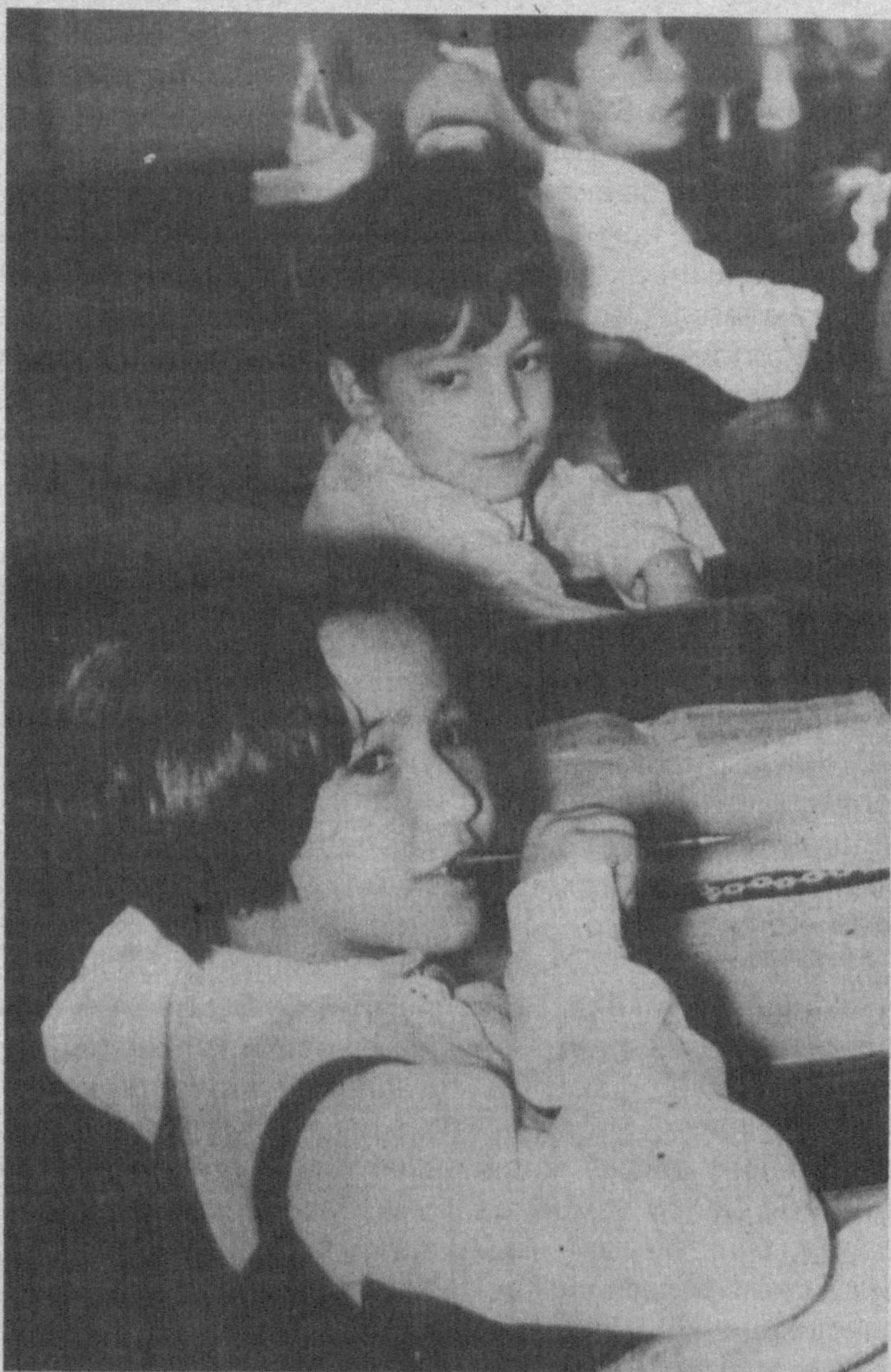
ОНА ТИЛИМ, СЕН БОРСАН ШАКСИЗ БУЛБУЛ КУЙИН ШЕЪРГА СОЛАМАН, СЕН ЙЎҚОЛГАН КУНИНГ ШУБҲАСИЗ, МЕН ҲАМ ТЎТИ БЎЛИБ ҚОЛАМАН!

ҳолатни у кишига ўзбекча муружаат қилганимизда яққол кузатдик. Сузимизнинг қоқ уртасидан булиб: «Девушка, давай говорить по-русски или не умеете что ли?» — дедилар, қошларини чимириб. Бу «илик» муомалани эпитиб гимназияга келлаётиб кунглим осмонда чарҳ ураётган гузал уй-хаёллар-