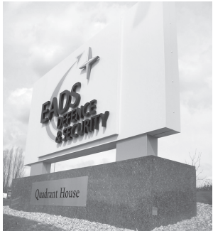
"Европанинг аэрокосмик саноатида фаолият олиб борувчи "EADS" концерни мавжуд иш ўринларини 5800 тага қисқартиради.

Европанинг аэрокосмик саноатида фаолият олиб борувчи "EADS" концерни мавжуд иш ўринларини 5800 тага қисқартиради.