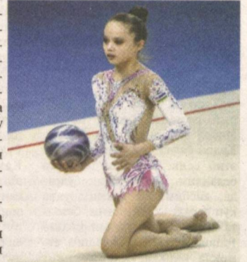
Тўғри, шаҳар худудларида спортнинг ушбу тури бўйича алоҳида махсус мактаблар, тўғараклар бор. Эндиликда гимнастика билан шуғулланиш учун қишлоқдан шаҳарга ёки туман марказларига боришнинг ҳолати қолмади.

Бугун нафақат шаҳарларда, балки оқил ва чекка қишлоқларда ҳам замонавий спорт мажмуаларига қўзингиз тушади. Ўзбекистонда болалар ва ёшларни спортга жалб қилиш бўйича уч босқичли тизим шакллантирилди.