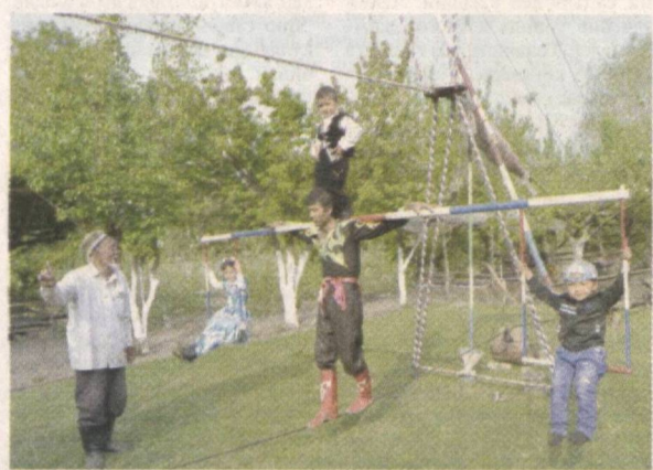
тегишли диплом соҳибига айланди. Унга энди Ўзбекистон Республикаси миллий дорбозлик халқ жамоаси ўнвони берилди!