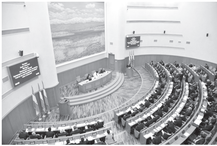
(Давоми. Бошланиши 1-бетда).

Қайд этилганидек, киритилган ўзгариш ва қўшимчалар сиёсий партияларнинг, фуқаролик жамияти институтларининг жойлардаги ижтимоий-иқтисодий ривожланиш билан боғлиқ бўлган гоёт муҳим вазифаларни ҳал қилишдаги ролини янада кучайтиришни, аҳолининг уй-жой-маиший шароитларини яхшилаш,