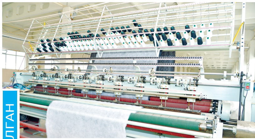
ЎЗБЕКИСТОНДА ИШЛАБ ЧИҚАРИЛГАН

мамлакатимиз кичик бизнес ва хусусий тадбиркорлик субъектлари фаолиятида муҳим омил бўлмоқда