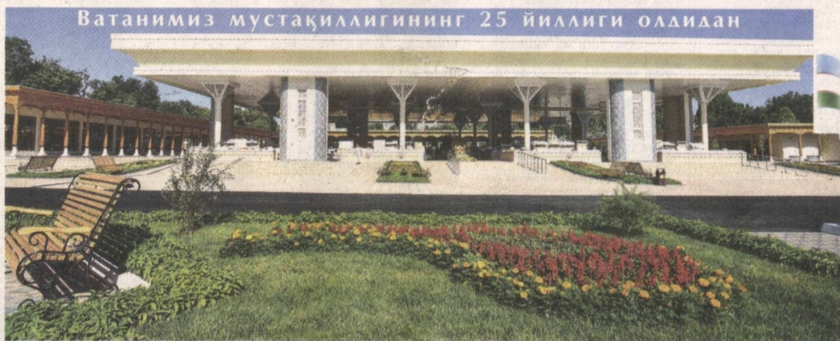
Ватанимиз мустақиллигининг 25 йиллиги олдидан