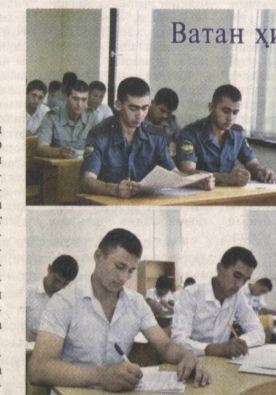
Ватан ҳимояси — муқаддас бурч

Давлатимиз раҳбарининг 2005 йил 19 апрелдаги «Ўзбекистон Республикасида ҳарбий таълим тизimini тақомиллаштиришга оид қўшимча чора-тадбирлар тўғрисида»ги фармойиши бу борада дастуриламал бўлмоқда. Ушбу ҳужжатта мувофиқ олий ҳарбий таълим муассасаларида тест синовлари ҳар йили 10 июлда ўтказилиб, курсантликка қабул қилинганлар рўйхати 15 июлда эълон қилинмоқда. Мазкур фармойиш тўғрисида олий ҳарбий таълим муассасаларининг курсантлари билан тўқнашиш сифати