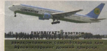
"HURRIYAT" gazetasi, Ўзбекистон ҳаво йуллари миллий авиаконкомпанияси самолётларида ҳам йўловчиларнинг доимий ҳамроҳи.

Ўзбекистон Республикаси Олий Мажлиси Сенати Кенгаши томонидан шу йилнинг май — июнь ойларида мамлакатимиз бўйлаб ўтказилган муҳим ижтимоий-сиёсий тадбир — фуқаролар йиғинлари расмлари ва уларнинг маслаҳатчилари сайловининг якунига бағишланган кенгайтирилган йиғини ҳамда брифинги ташкил этилди.