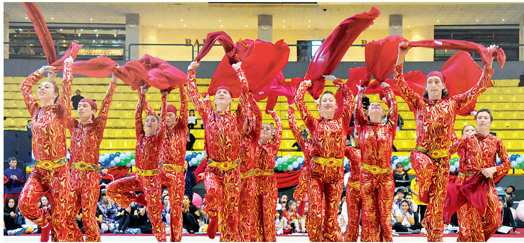
Пойтахтимиздаги "Ўзбекистон" спорт мажмуасида "Гимнастика барча учун" Ўзбекистон очик чемпионати бўлиб ўтди.