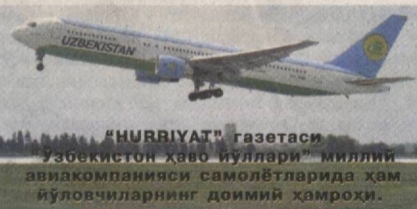
"HURRIYAT" газетаси Ўзбекистон ҳаво йўллари миллий авиакомпанияси самолётларида ҳам йўловчиларнинг доимий ҳамроҳи.

Тобора яқинлашиб келаётган қутлуг байрамимиз – Ўзбекистон давлат мустақиллигининг 25 йиллиги муносабати билан хорижий мамлакатлар вакиллари билан халқимиз номига йўлланган табриклар келиши давом этмоқда.