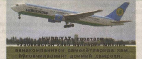
«HURRIYAT» газетаси Ўзбекистон қаёву йуллари миллий авиаконаняси самолётларида ҳам йўловчиларнинг доимий ҳамроҳи.

19 сентябрь куни Ўзбекистон Республикаси Президенти вазифасини бажарувчи Шавкат Мирзиёев «Ҳайвонот дунёсини муҳофаза қилиш ва ундан фойдаланиш тўғрисида»ги Ўзбекистон Республикаси Қонунига ўзгартириш ва қўшимчалар киритиш ҳақидаги Ўзбекистон Республикасининг Қонунини имзолади ва у матбуотда эълон қилинди.