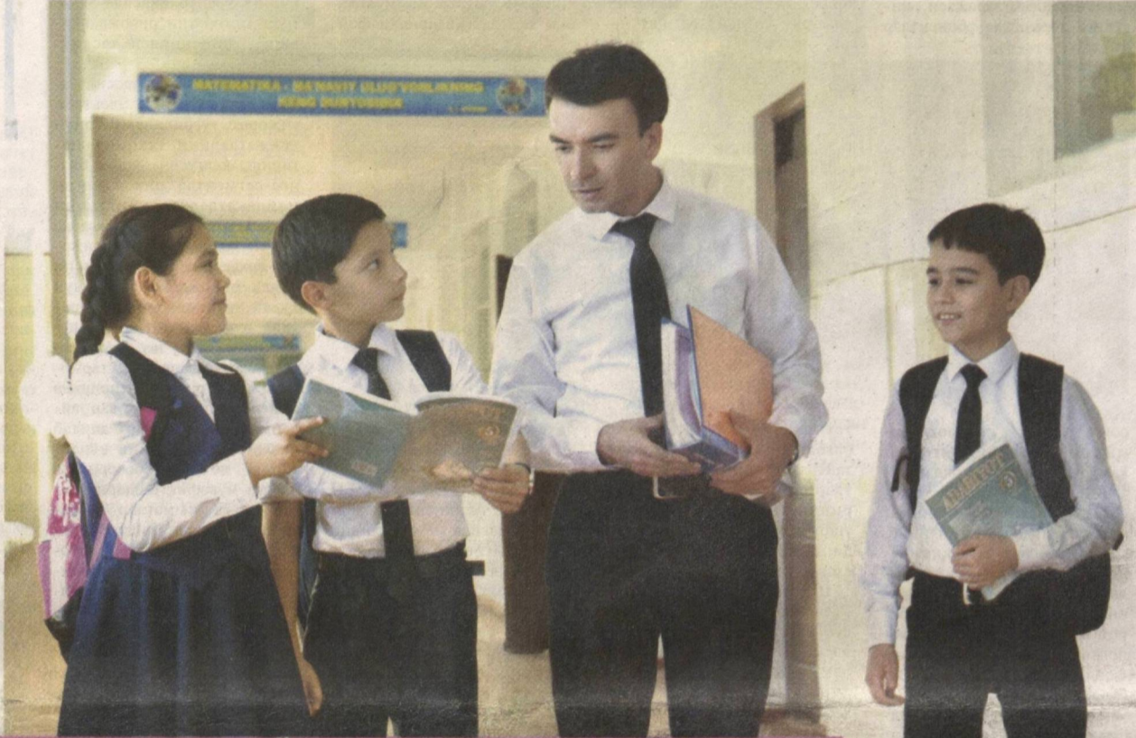
► 1 октябрь — Ўқитувчи ва мураббийлар куни