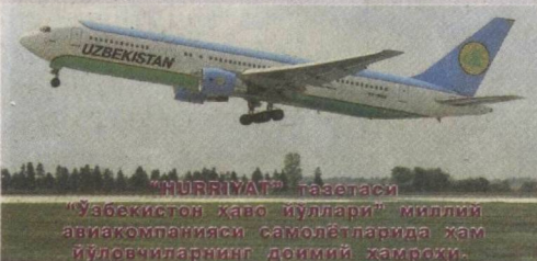
"HURRIYAT" газетаси "Ўзбекистон ҳаво йуллари" миллий авиакомпанияси самолётларида ҳам йўловчиларнинг доимий ҳамраҳи.

30 ноябрь куни Ўзбекистон Республикаси Президенти Шавкат Мирзиёевнинг "Ўзбекистон Республикаси Инновацион ривожланиш вазирлигини ташкил этиш тўғрисида"ги фармони матбуотда эълон қилинди.