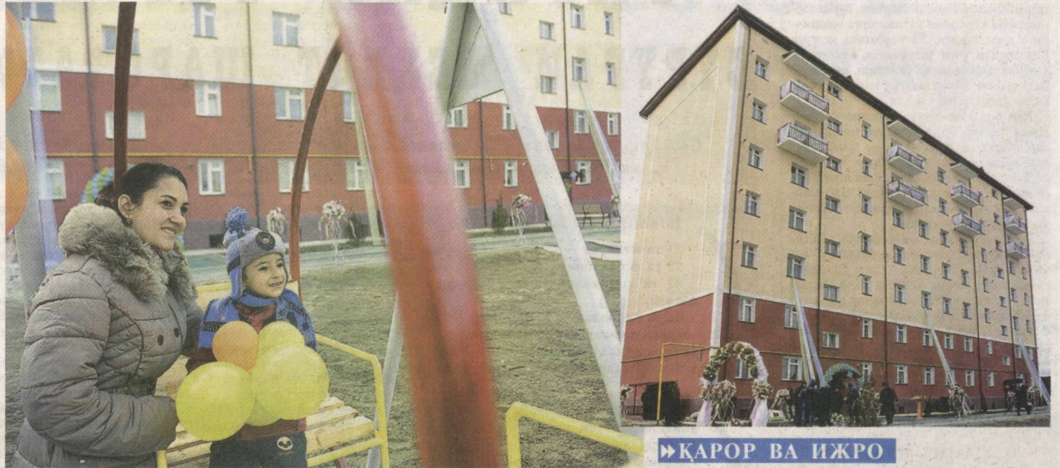
► ҚАРОР ВА ИЖРО