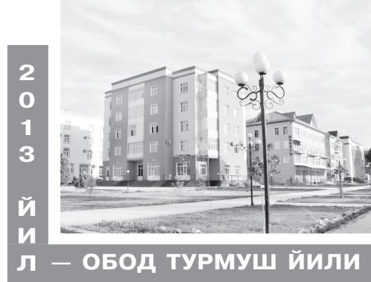
2013 йил — обод турмуш йили

Кексаларни эъозлаш, уларнинг хурматини жойига қўйиш, ҳолидан хабар олиш халқимизга хосдир. Бу ҳислат, айниқса, истиқлол йилларида янгича мазмун-моҳият касб этди.