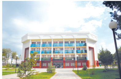
ТИББИЁТ ХОДИМЛАРИ КУНИ ОЛДИДАН

“Соғлом халқ, соғлом миллатгина буюк ишларга қодир бўлади”, деган сўзларида ёрқин акс этган.