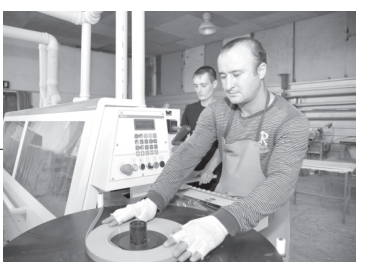
Президентимиз таъкидлаганидек, тузилишига кўра икчам, қарорлар қабул қилишда тезкор ва ҳаракатчан, янги тартиб-қоидаларни қисқа муддатда ўзлаштирадиган кичик бизнес жаҳон ва минтақалар бозорларидаги талаб ва конъюнктура ўзгаришларига анча тез мослашади. Кичик бизнесни ташкил қилиш ва юритиш катта харажат ҳамда капитал қўйилганлиги талаб этмайди. Бу эса ишлаб чиқаришни тез ва осон модернизация қилиш, техник ҳамда технологик қайта жиҳозлаш, янги турдаги маҳсулотларни ўзлаштириш, уларнинг номенклатурасини мунтазам янгиллаб бериш ва рақобатдошлигини таъминлаш имконини беради. Жаҳон молиявий-иқтисодий инқирозининг таҳдиди ва салбий оқибатларига йирик корхоналарга нисбатан ушбу соҳанинг бардош бера олиш қобилияти анча юқорида.

— Президентимиз ҳар бир чиқаришда биз, тадбиркорларнинг эмин-эркин фаолият юритишимиз учун қандай шароит зарур бўлса, барчасини яратиб бериш лозимлигини таъкидлайдилар. — дейди Наманган туманидаги "Водий ёғоч сав-