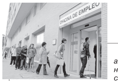
Энди ўйлаб кўринг, иш жойидан айрилганларнинг кейинги тақдирини маълум қилиш қанчалик қийин бўлади? Ҳозирча бундай саволга тайинли жавоб йўқ. Шу

Умуман, халқаро миқёсдаги мавжуд аҳволдан шу нарса аён бўлиб бормоқдаки, инқироздан чиқиб жараёни ҳали яна узоқ давом этиши кутулаётгани ва унинг қачон тугаши ҳақида олдиндан бир нарса дейиш кўп жиҳатдан қийин бўлиб қолмоқда. Ўзбекистоннинг глобал молиявий-иқтисодий тангликнинг салбий оқибатларини юмшатиш ва бартараф этиш борасида эришаётган натижалари халқаро экспертлар томонидан қайта ва қайта эътироф эти-