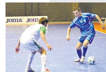
Кеча ўтказилган сўнгги турда қуйидаги натижалар қайд этилди: Тожикистон — Турк­манистон 5:4, Ўзбекистон — Қирғизистон 5:1.

Дастлаб Туркменистон терма жамоаси билан куч синашган ҳаётларимиз 10:1 ҳисобида эъло қалаба