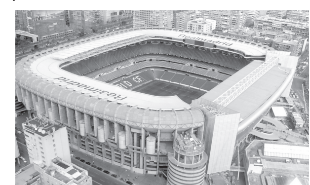
Хориж матбуоти хабарлари асосида тайёрланди.

Маҳаллий матбуотда "Сантьяго Бернабеу" стадиони номини ўзгартириш юзасидан "Emirates Airlines" ҳам қизиқиш билдираётгани ҳақида хабарлар пайдо бўлган.