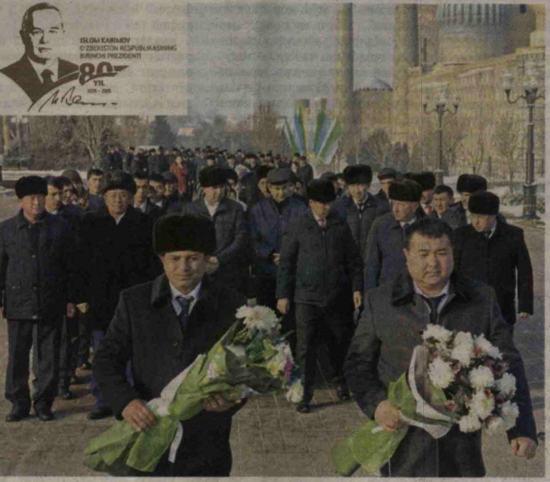
30 январь куни мамлакатимизда Биринчи Президентимиз Ислоҳ Каримов таваллудининг 80 йиллиги кенг миқёсда нишонланди.