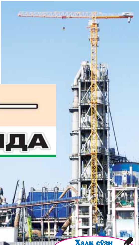
Хосен ПЛАТОНОВ (Халқ сўзи) ва Жасирбек ҚУЗИМУРДОВ (ЎЗА) олон суратлар.