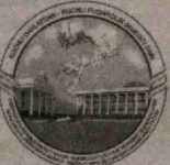
Ушбу мақола Ўзбекистон Республикаси Олий Мажлиси ҳузуридаги нодавлат-нотижорат ташкилотларини ва фука-ролик жамиятининг бошқа институтларини қўллаб-қувват-лаш Жамоат фонди томонидан давлат субсидияси ажратил-ган «Ҳаракатлар стратегияси — юлғалиш стратегияси» номли лойиҳа асосида чоп этилмоқда. (С/12)

ЗИВга кенг миқёсда чет эл вен-чур капитали ва мутахассисларини жалб этиш осон кечади. Навоий шаҳрида логистика ва инфрастру-ктура мавжуд. У бошқа худудларда-ги инновацион кластерларга ёрдам кўрсатади. Соҳада етакчи бўлади. Истиқболда мамлакатимиз киёфасини, иқтисодий салоҳияти-ни юксалтиришга ҳисса қўшади-ган инновацион ишлаб чиқариш сари дадил қадамлар қўйилмоқда. Бу Ҳаракатлар стратегиясида бел-гилаб берилган улкан вазифалар-га жуда мос.