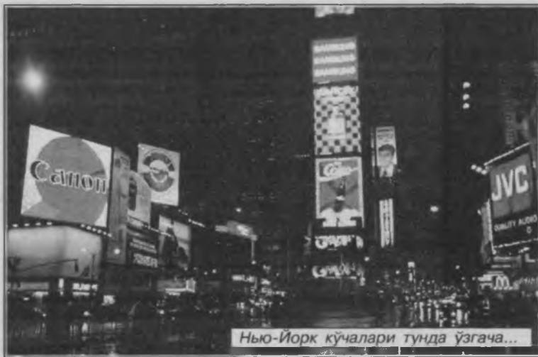
Нью-Йорк кўчалари тунда ўзгача...