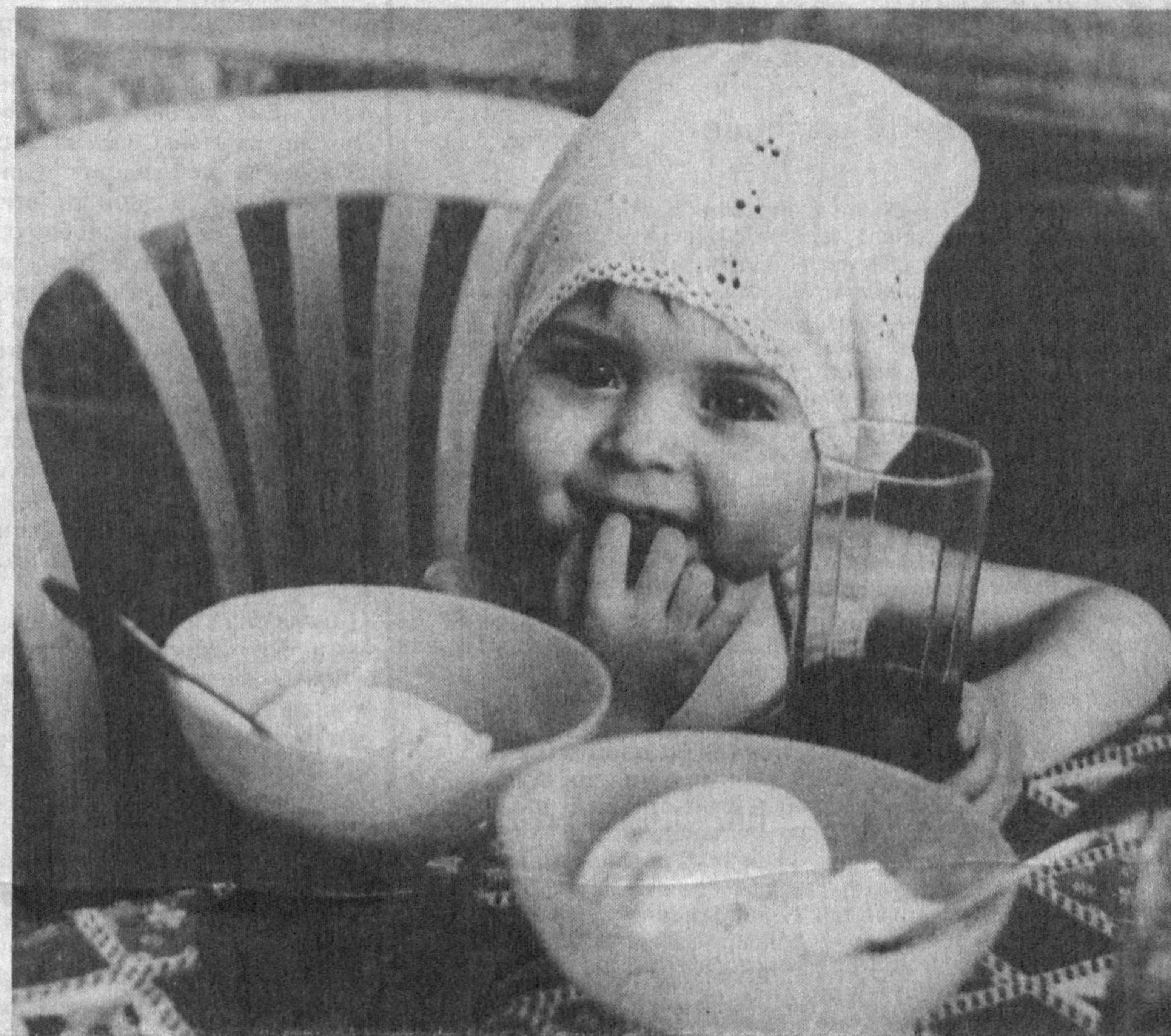
— Ҳадемай ёз келади!

Биз ҳозирги реал воқеликни инобатға олиб, янги партия ўз сағида лоқайдлиги ёки кўрқоқлиғидан боши доимо ҳам, бошлиқларнинг сонига ҳам икки қат бўлиб салом берадиган, уларнинг ҳар бир сўзиға "хўп бўлади", "бажарамиз" деб жавоб қайтарадиган "мурват"лар эмас, ддддд, шайтоатли, ҳалол, фидойи шахсларни бирлаштирсин демократия. Нафакат партия аъзоси, барча фуқаролар ҳам бугунға келиб лоқайдлик, сепардизмнинг жиноят билан тенг, жамият тараққиёти йўлидаги хиёнат эканлигини англаб етсин деймиз. Қадимги Рим файласуфи Марк Аврелийнинг қуйидаги сўзлари ҳар биримизнинг онгимизға чуқур сингит бориши зарур: "Адолатсизлик ҳамма вақт ҳам қандайдир фаолият билан боғлиқ бўлавермайди; кўпинча у қайтаға фаолиятсизликдан иборат бўлади".