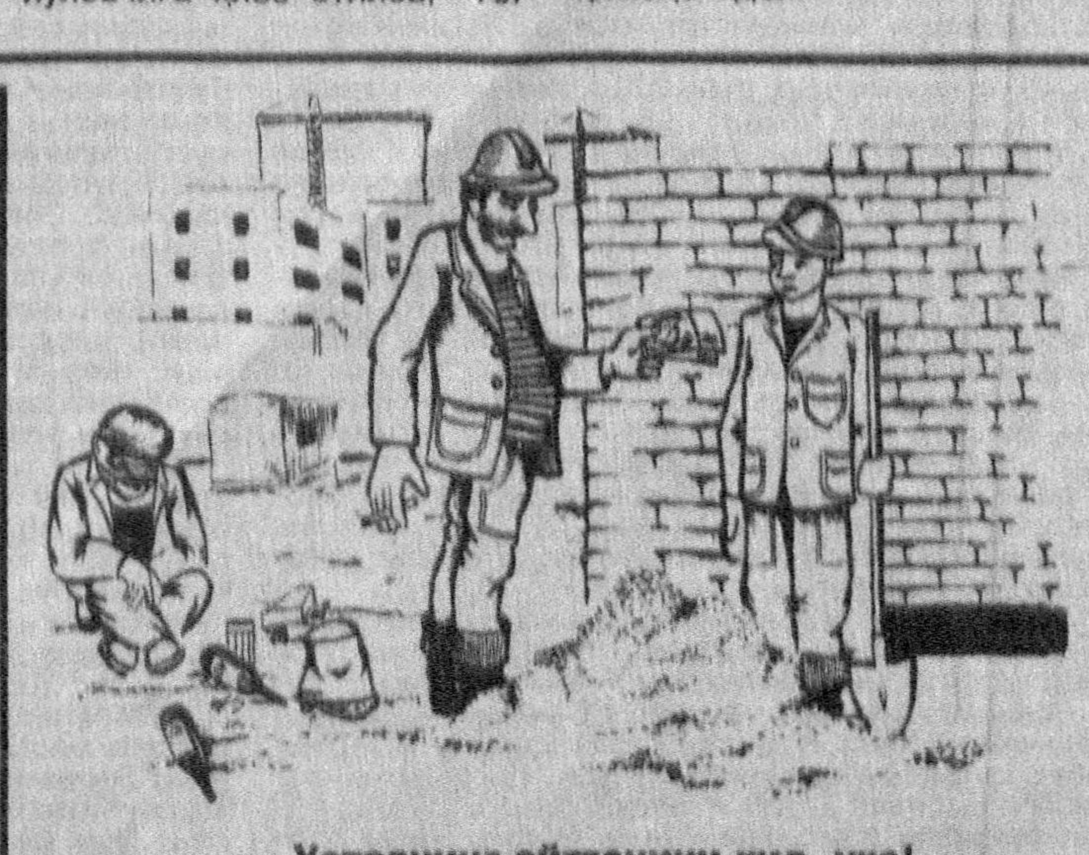
— Устознинг айтганини қил, ука!

помешни ўзгалардан кам дена..." мақоласида миллат тарихи, ўтмиши, қадриятлари ҳақида ўқувчи ўзи учун қизиқарли фактлар олади. "Сийсий иқлим" рўқни эса ҳамма учун бирдек қизиқарли. Дарвоқе, газета ўзи айтқандек, ўз гапи билан чиққан. Назаримда, бу гап ўқувчи кўнглидаги гап билан ҳамохандек.