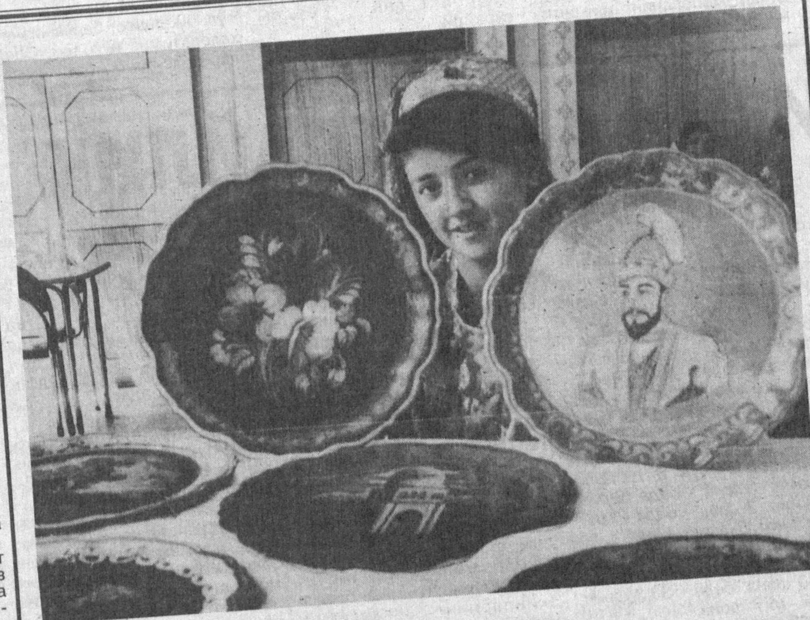
Кўли гул соҳибжамол.