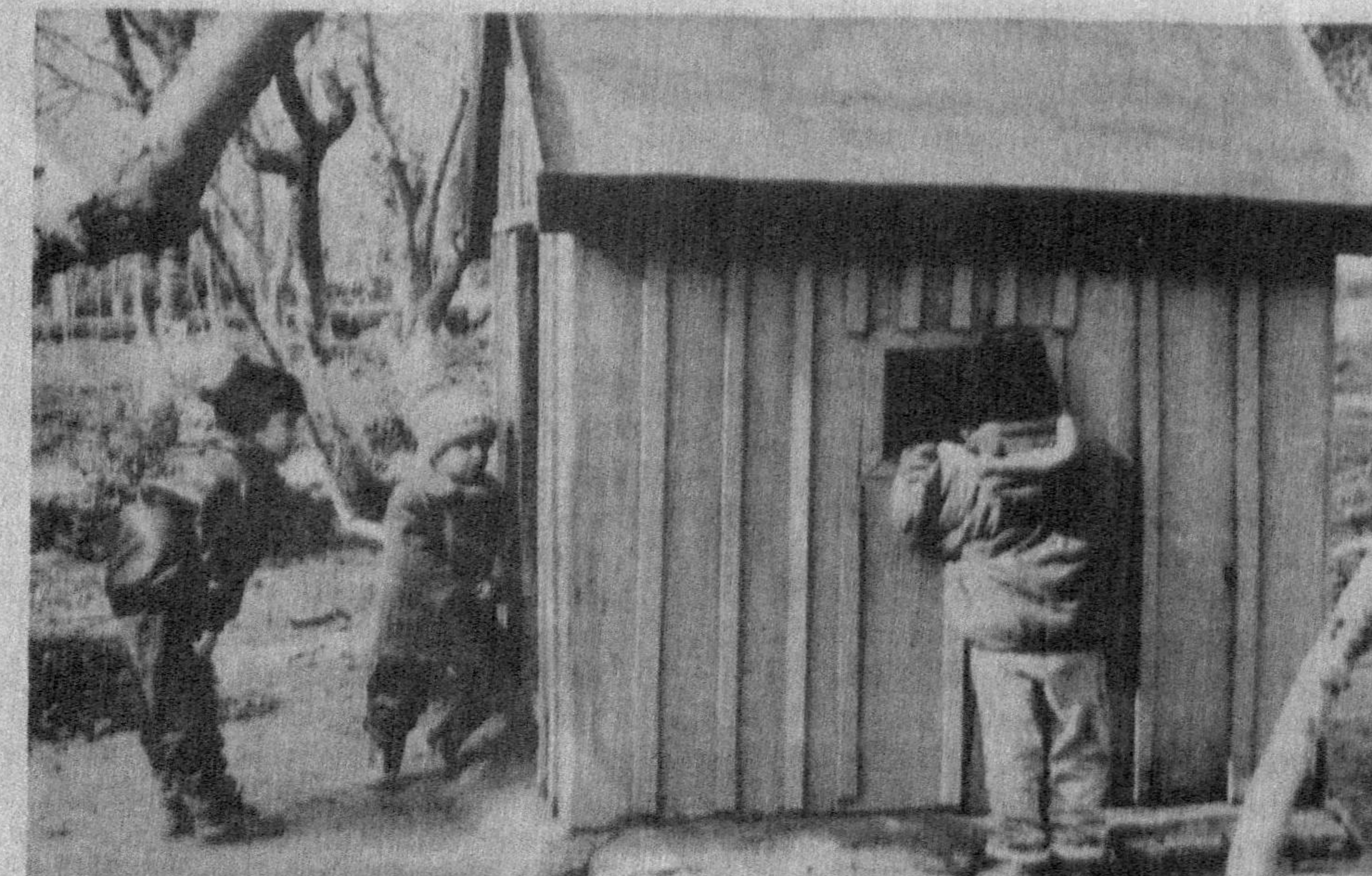
— Вой, эгаси қани?