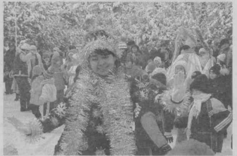
Суратда: арча байрамидан лавҳа.