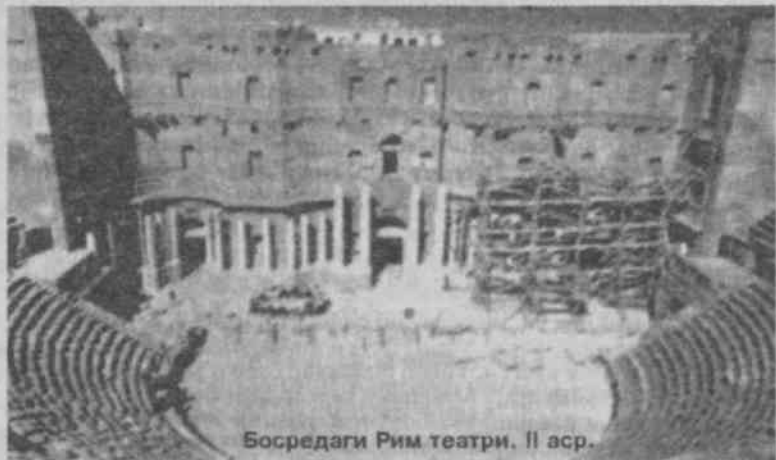
Босредаги Рим театри. II аср.

ки, ўзимиз бошқалар учун намуна бўлишимиз мумкин. Бу тузум демократия деб аталади. Чунки, озчиликнинг эмас, кўпчиликнинг манфаатларига асосланади. Хусусий манфаатлар учун қонунларимиз ҳаммага бир хил ҳуқуқ беради. Масаланинг сиёсий аҳамиятига келсак, кимдир қандайдир уюшманинг қўллаб-қувватлаётгани туфайли устунликка эга бўлмади, балки ҳар ким ўзининг шижоатига мос бўлган ўринни эгаллайди. Камбағалнинг паст даражаси уни давлатга хизмат қилиши имкониятидан маҳрум этмади”, деган эди.