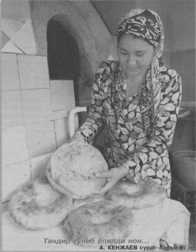
Тандир тўлиб ёпилди нон...