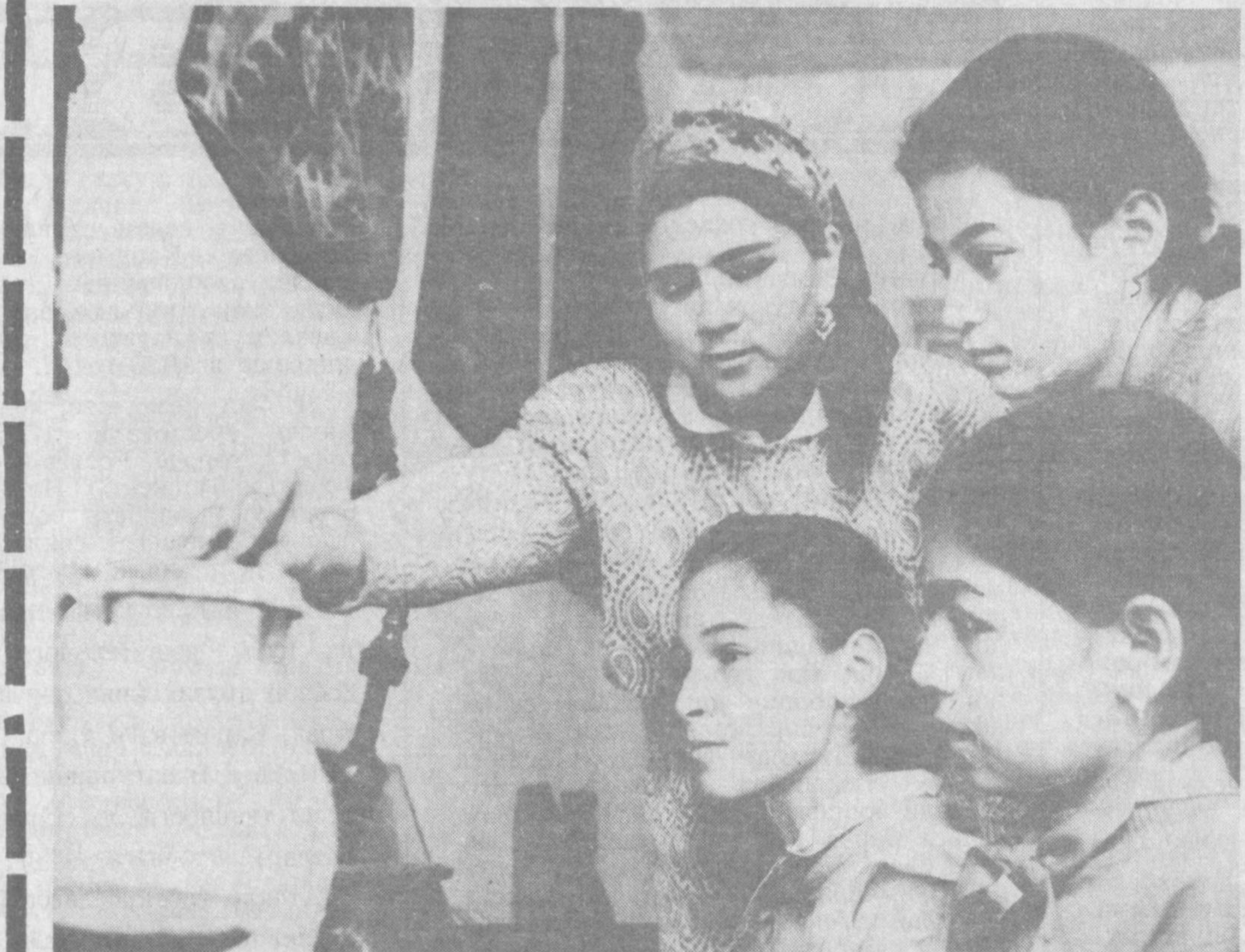
Қарши ноҳиясидаги 10-мактабнинг тарих ҳайкалини ўқувчилар билан ҳамкорликда ўлкашунослик музейини ташкил этди.

билим — бойлик, у камбағал қилмағай келиб ўғри, қаллоб уни олмағай уқуш ул сенга эзгу атлиғ адаш билиғ ул сенгар кез бағирсақ қазаш