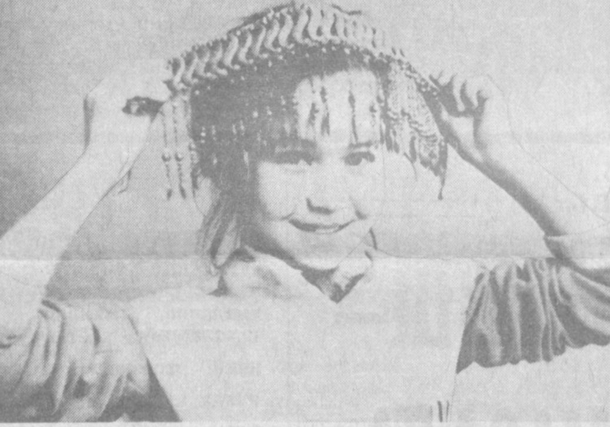
Музейда қадимий усталар ишлаган тақинчоқ ва безаклар, кийимлар, танга пуллар мавжуд.