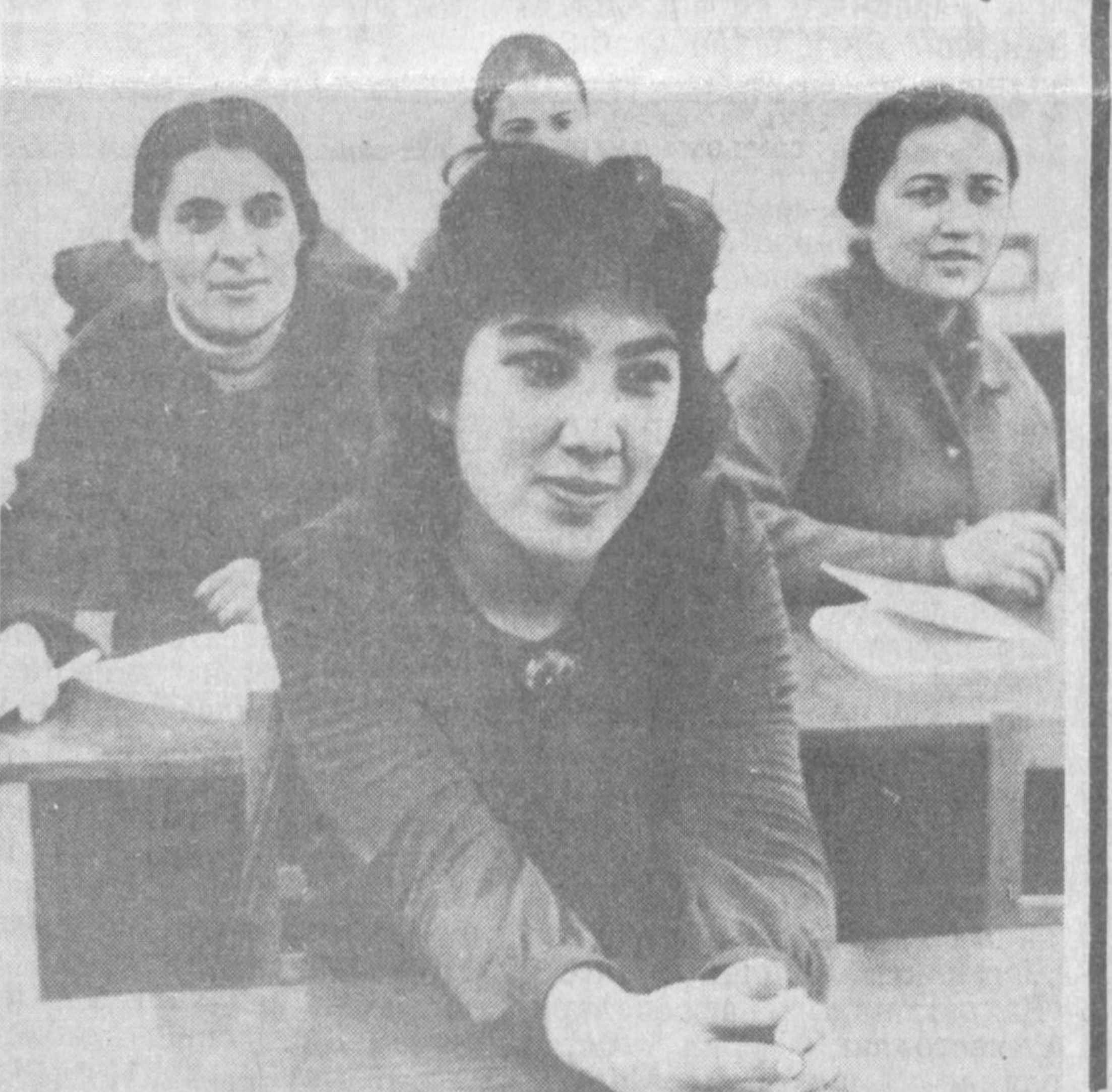
Тошкент вилояти ўқитувчилар малакасини ошириш олий билимгоҳи ҳамшира педагоглар билан гапкўр. Суратларда: малака ошириш олий билимгоҳида таълим олаётган ўқитувчилар лекция тинглашмоқда.