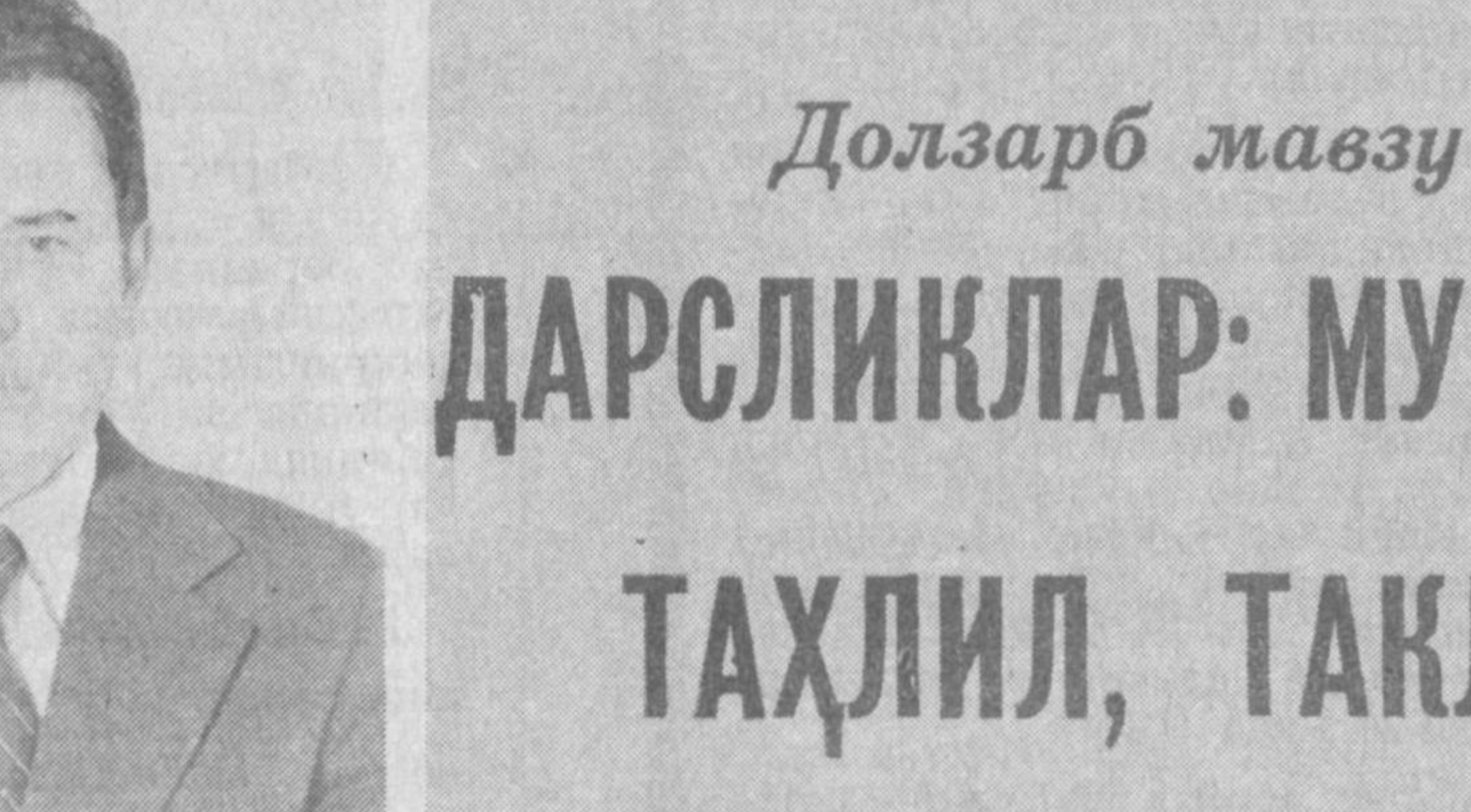
ка бўйича 7 тилда 140 номда 25 миллион нусха дарсликни жойларга етказдик.

амалга ошираётган ишларимизни халқ орасида мукамал тарғибот қилолмаймиз. — Мактабларга ҳар йили неча номда дарслик тарқатилаяди? — «Ўқитувчи» нашриетидан ҳар йили 20 миллиондан ортиқ дарслик чиқарилади. 1-синфдан 12-синфга 160 номда ўқув китоби олинади. Бу йил республи-