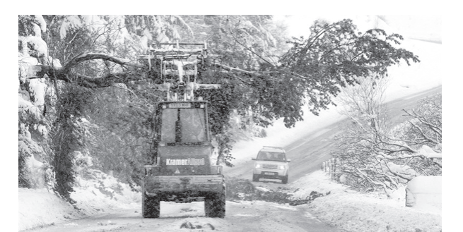
Хориж матбуоти хабарлари асосида тайёрланди.

Хусусан, Франциянинг баъзи туманларида транспорт ҳаракати қийинлашган. Айрим жойларда электр таъминоти узилиб қолган, кўплаб даракларнинг шохси синиб кетган. Об-ҳавонинг фавқулодда бундай ўзгариши одамларни саросимага солиб қўйди. Аслида эса синоптиклар мазкур ҳудудлар томон ёнғингарчиликларга сабаб бўлувчи циклон ҳаракатланаётгани ҳақида бир кун аввал хабар қилган эди. Аммо маҳаллий аҳоли вакиллари метеорологларнинг унинг хавфлилик даражаси тўғрисида батафсил маълумот бермаганида айблamoқда.