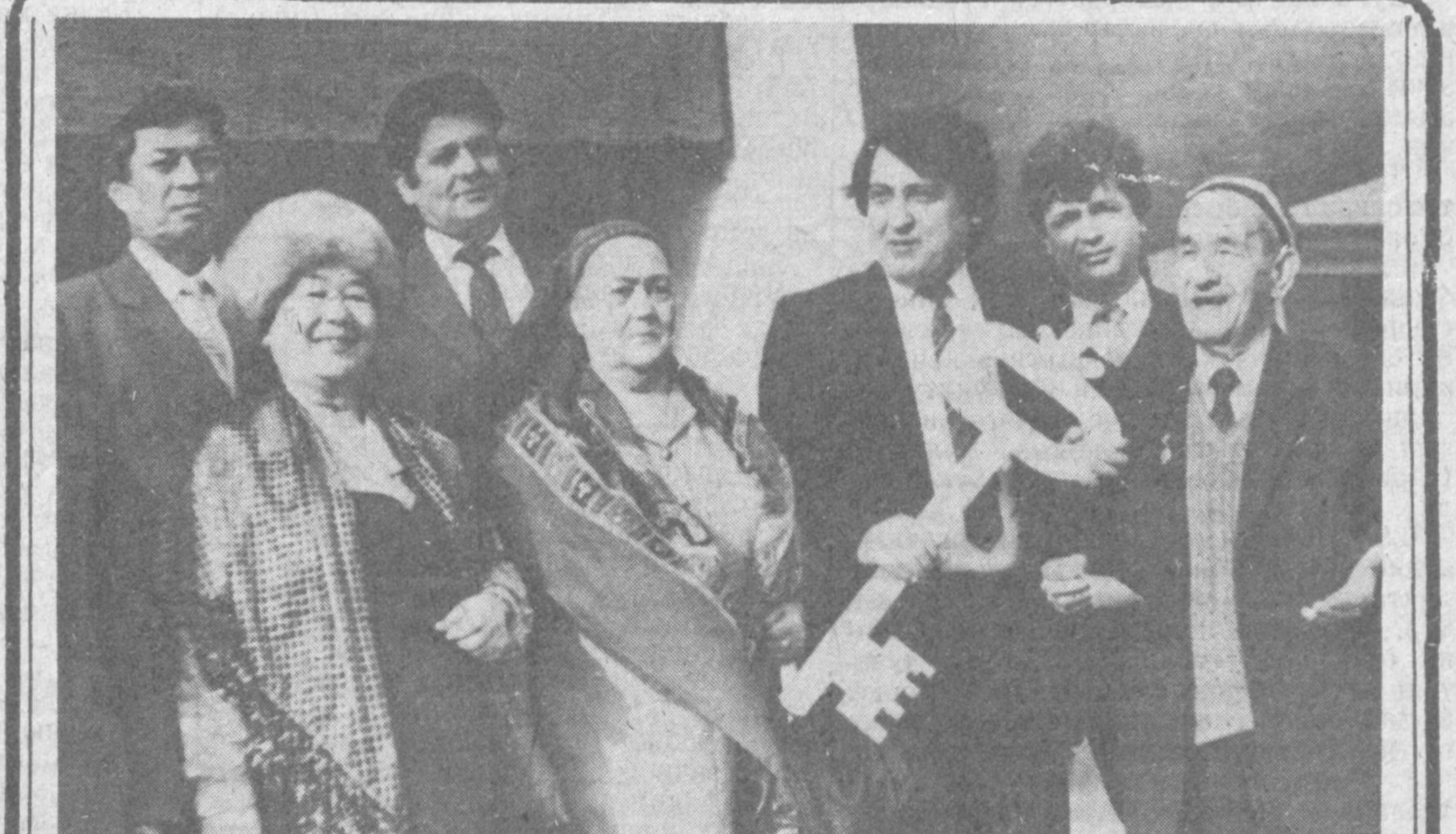
«ЎҚИТУВЧИЛАР УЙИ»ГА МАРҲАМАТ!

Улар айрим вазириликлар, идоралар, банк муассаса- лари, олий ўқув юрталари раҳбарларининг масъулият сизилтириш оқибатида стипен- диялар ва кўпонар ўз вақ- тида берилмаганлигидан, нон кечкиб келтирилганли-