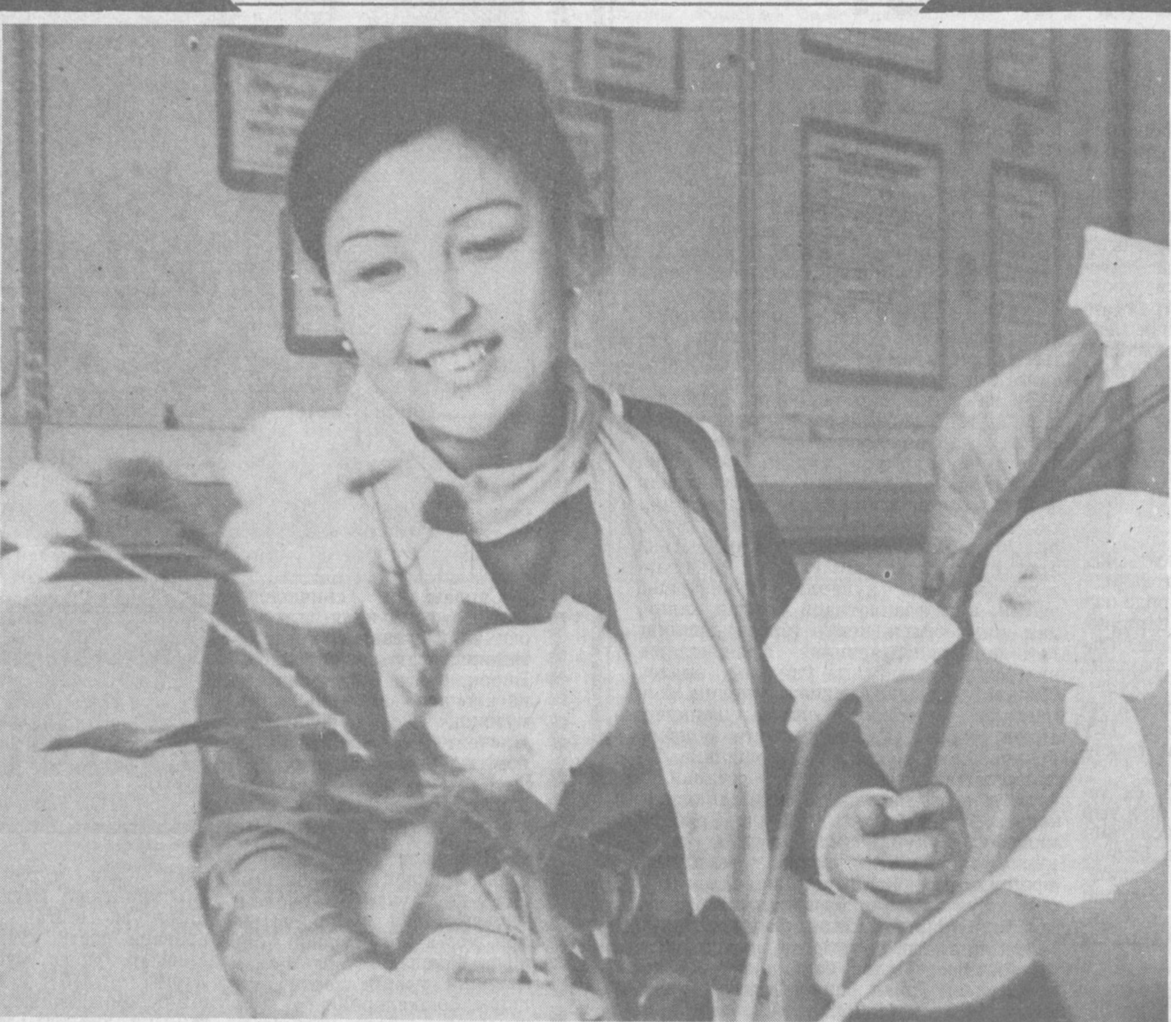
Тухфа қилсак гулдастalar, Гулчехралар яшнаб кетар.

Шоҳ уддирки, райياتга тараҳхум қилса, Йўқ, эса қондан амну омон барча абас. деа шеър битган шоира ота-сининг тахтига ўтирган ўғлига бош йўриқчи бўлиб тур-