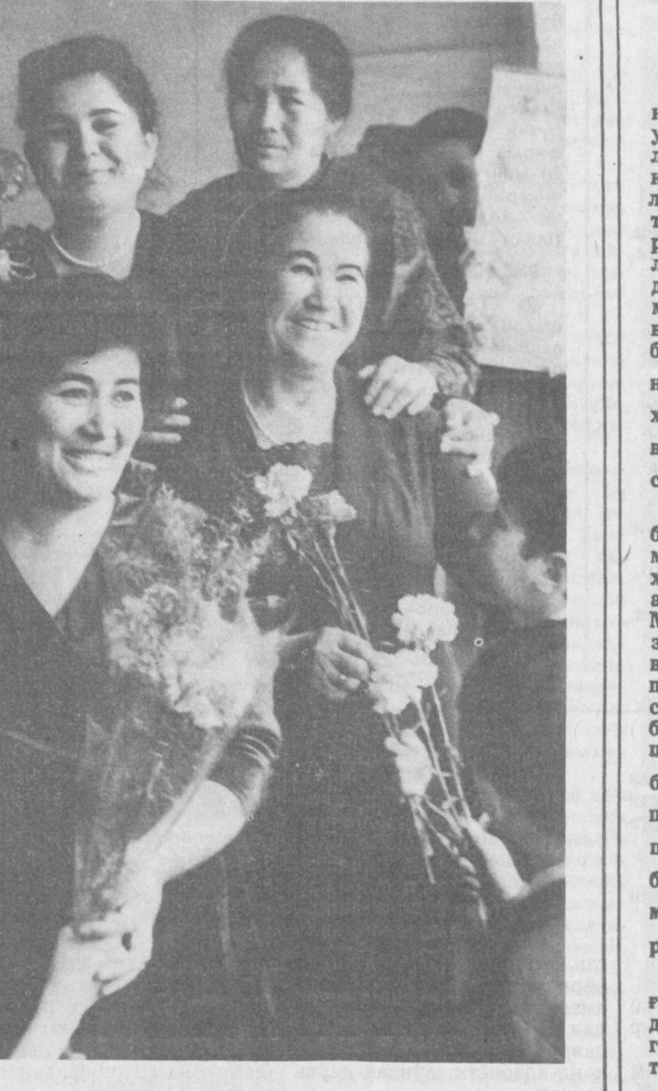
Пойтахтдаги 83-мактабда хотин-қизлар байрамга ба- гишланган тадбир бўлиб ўтди. Ўқувчилар муаллималари- га куй, қўшиқ ва рақслардан тузилган гулдастасини тух- фа этишди.

Мақсад эзгулик бўлгач, меҳнатингиз, меҳрингиз ая- масанг, омад, албатта, сенга юз бураркан, дейди А. Азизов. Ўқувчилар саройи- да «Чамай» ўзбек ёш рақ- қосалари фольклор-этно- график дастаси тузилди. Бунда жумҳурят пойтах- тидagi турли мактаблардан 120 дан зиёд ёш хаваскор- лар рақс тўғарагиди ишти- рок этиб, бу нозик санъат- сирларини ўргана бошла- дилар. Тинимсиз машъ ва изланишлар, санъатга му- ҳаббат ўз самараларини бера бошлади. Шундан сўнг ёшлар устозлари би- лан келишиб, машҳур ўз- бек раққосаси М. Турғун- боевнинг 80 йиллик тўйи