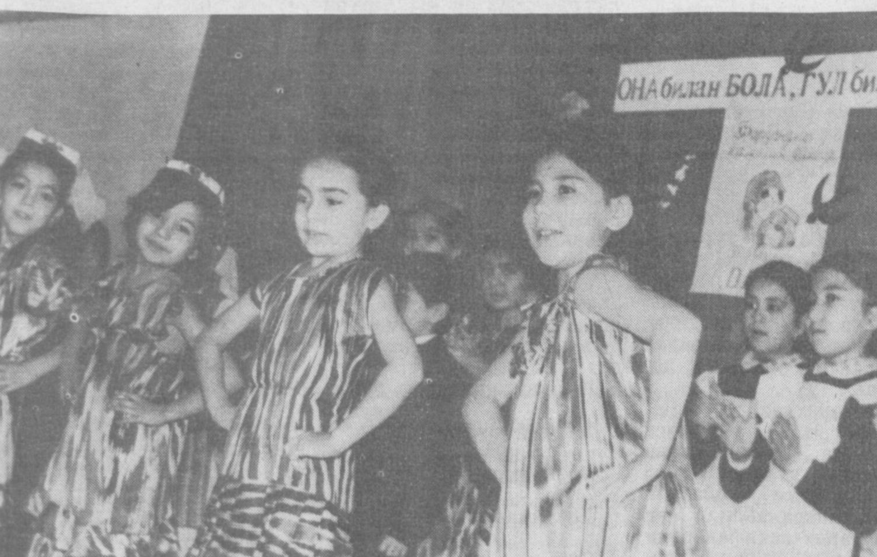
ОНАБИЗ БОЛА, ГУЛБИЛА

Она ҳақида жуда кўп яхши сўзлар айтилган ва айтимда, ёзилган ва яна ёзилганди. Курран замиён мавжуд экан, оналар қадри ҳамиша бошимиз эъза, Менинг ҳам оналарга ҳурматим чексан. Шу билан бирга азиз оналарга мурожаат қилиб ўзимнинг шахсий мулоҳазаларимни баён қилмоқчиман.