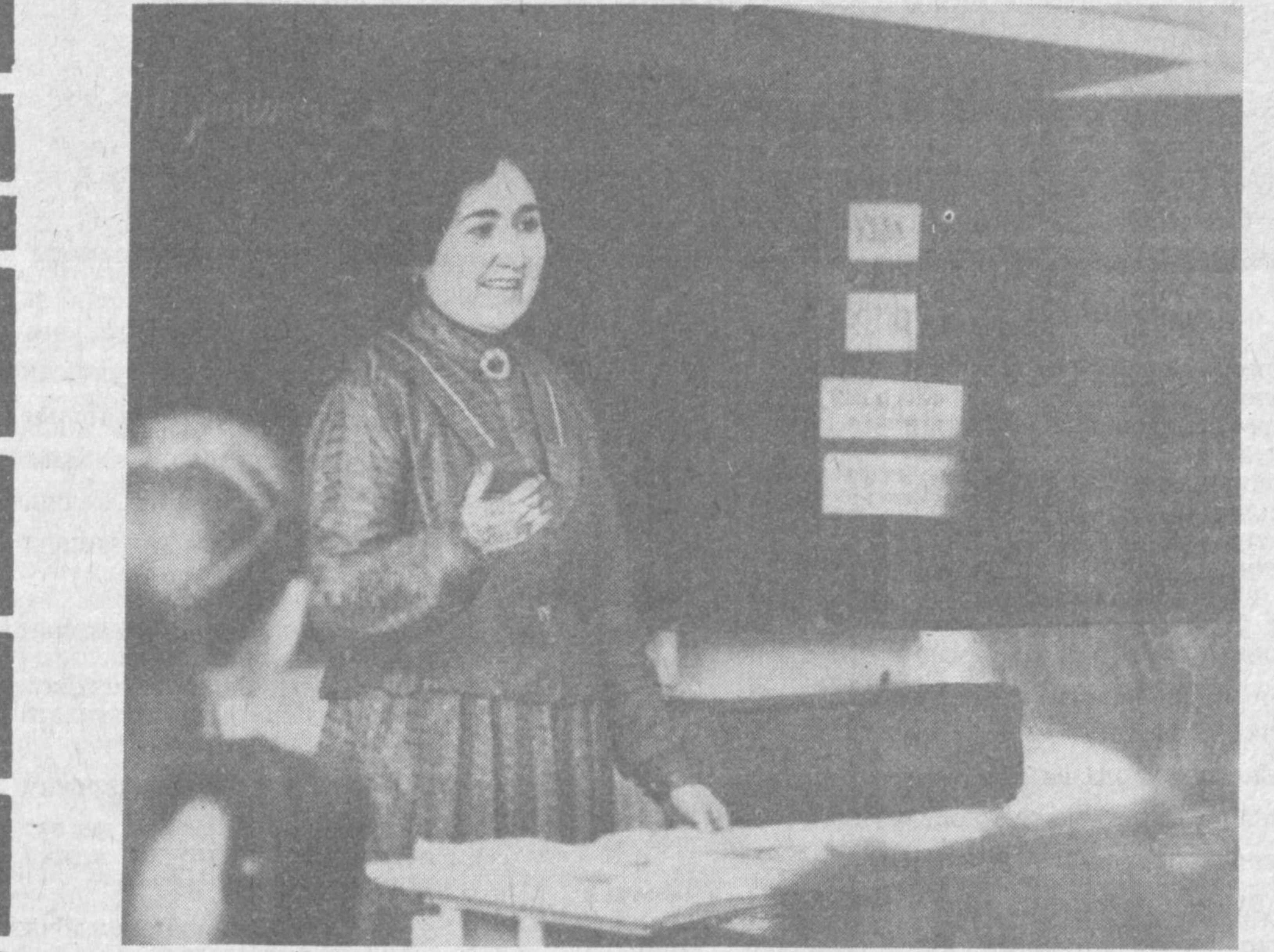
СУРАТДА: «Ўқитувчи-92» кўри-танловининг иштирокчиси Ш. Юсупова.