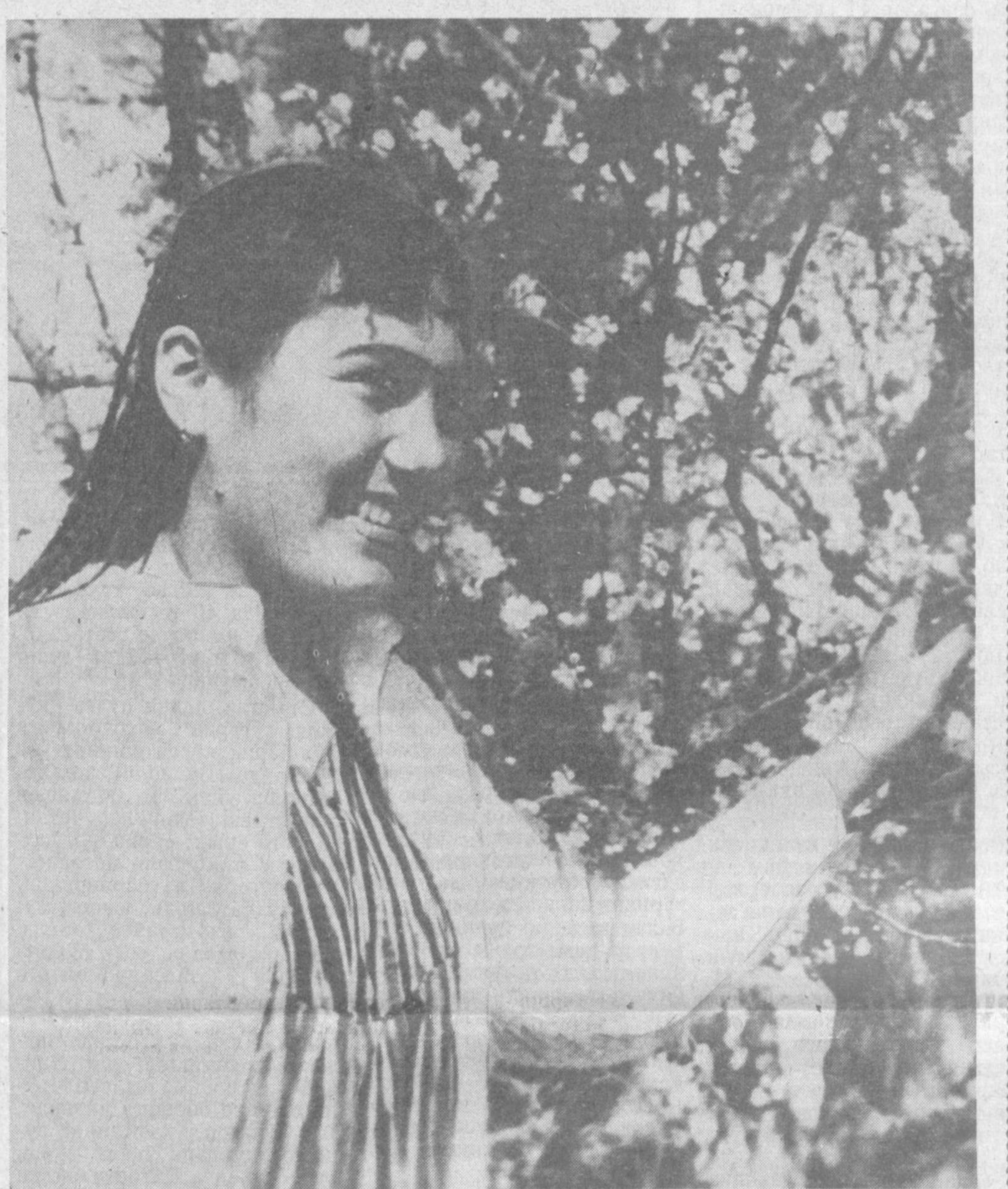
Гулга кирди бу боғлар, Гулгун айлаб дудоғлар...