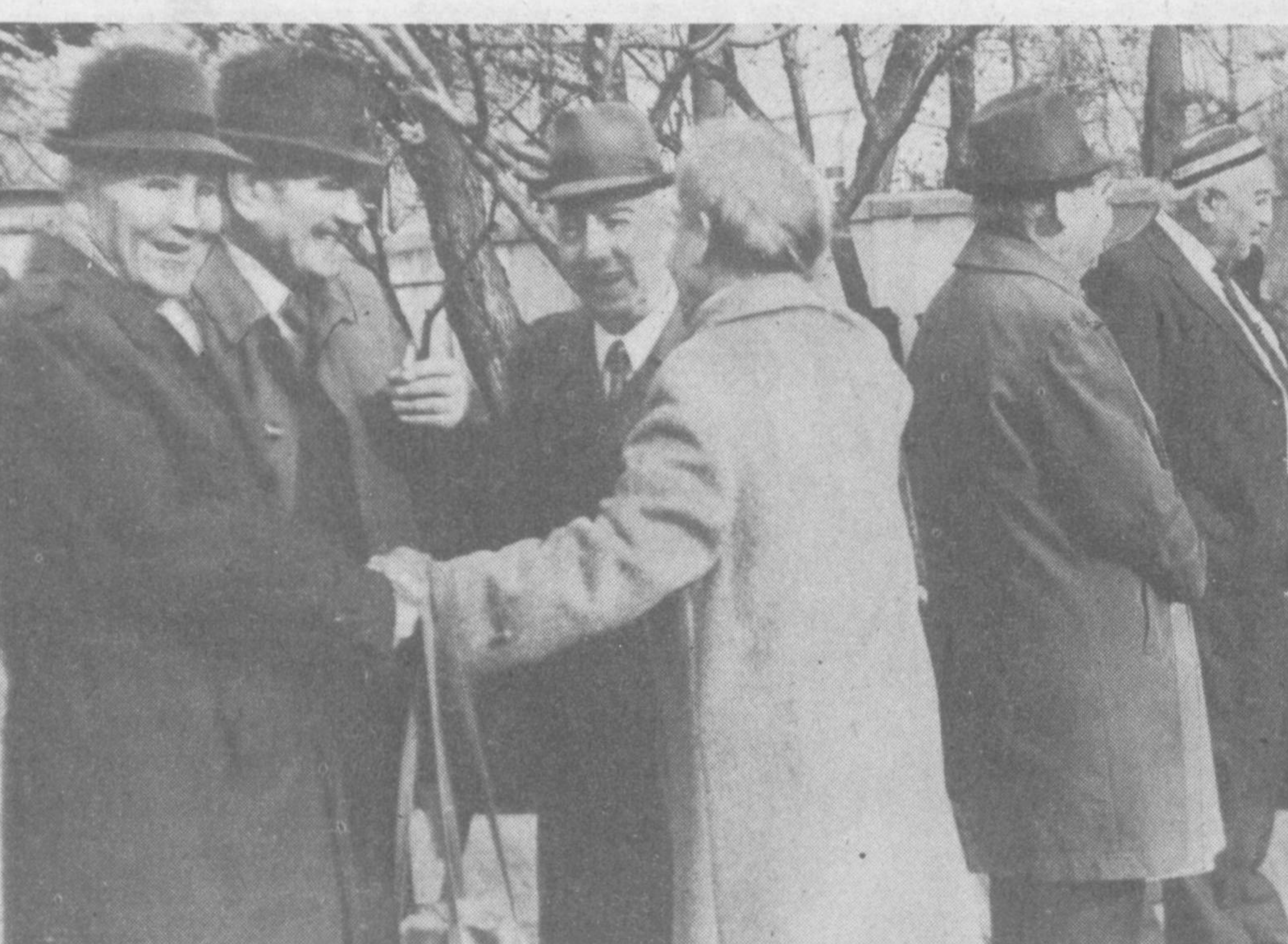
Тошкент шаҳар ҳалқ таълимни бош бошқармасида Наврўз айёмига бағишлаб ҳалқ таълимни фахрийлари билан учрашув бўлиб ўтди. СУРАТДА: учрашув қатнашчилардан бир гуруҳи.