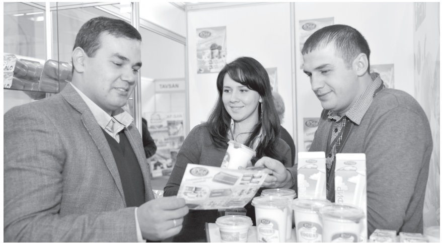
ларни саралаш ва қадоқлаш ускуналари, сақлаш қурилмалари, шунингдек, савдо дўконлари, супермаркетлар учун автоматлаштирилган тизимлар ишлаб чиқарувчилар бўлиб, бу тадбиркорларга

завотни қайта ишлаш ускуналари, бодгорчилик ва иссиқхона ҳўжаликлари учун ихчам техникалар, чопик ва хайдов тракторлари, сут соғиш ва сақлаш жиҳозлари, ветеринария препаратлари ва вакциналари, уруғлик, минерал ўғит ҳамда кимёвий воситалар шулар жумласидандир.