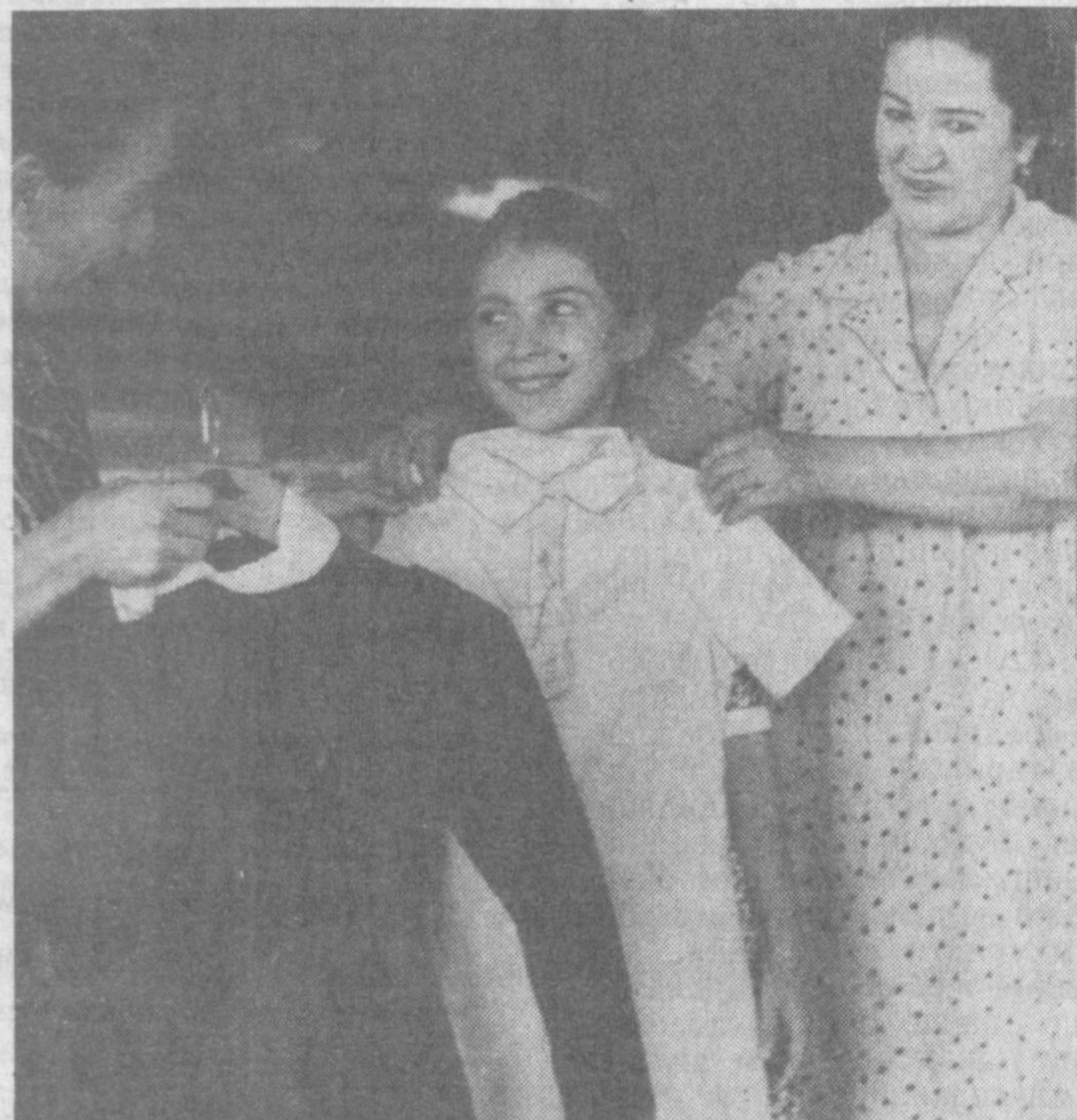
Янги ўқув йили олдидан жумҳуриятимизнинг барча район ва шаҳарларида ўқувчилар учун мактаб бозори фаоллият кўрсата бошлади. СУРАТЛАРДА: Тошкент шаҳрида ташкил этилган мактаб бозоридан давралар.