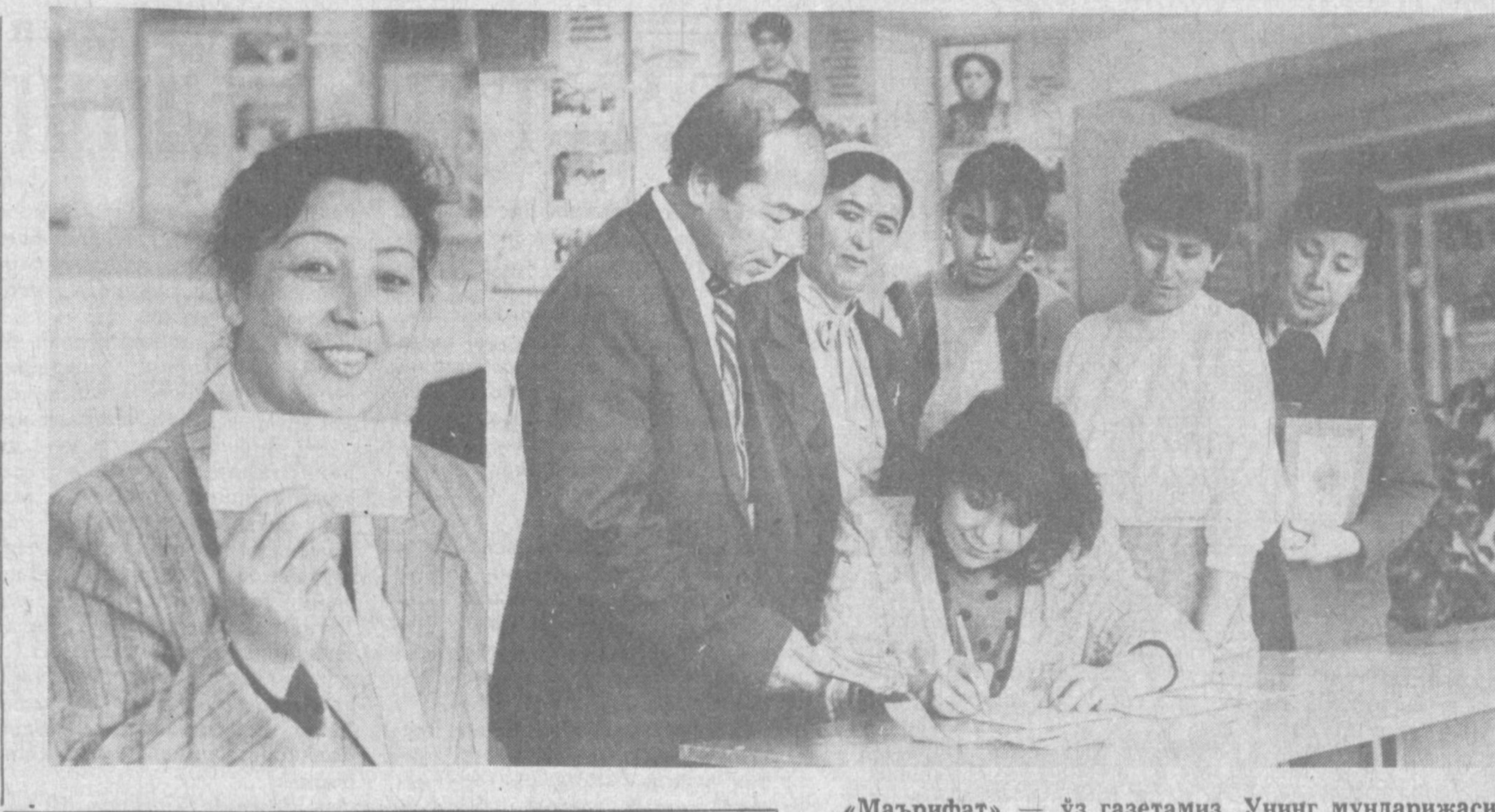
«Мазрифат» — ўз газетамиз. Унинг мундарижаси бой бўлиши, ўқинишли ва кенг қамровли эканлиги — ўзимизга болғиди, — дейишадиде Тошкентдаги 254-мактабининг мураббийлари. — Бунинг учун газетанинг ҳар бир сонини мунтазам ўқиб бориш ва унинг ўқинишли бўлишини таъминлаш намуналарини билан қатнашиш даркор. Қолаверса, «Мазрифат» бизнинг талаб ва истақла-римиз баёни бўлган хат-хабарларимизга суянади. СУРАТДА: газетига обунда бўлиш пайти.

Ҳурматли редакция! Мен мазкур хатимда дилим-дагиларни ёзмоқдаман. Редакция деганда, мен у ерда закий мутахассислар ижод қилишадиде деб биламан. «Мазрифат» газетасига ҳар йили обунда бўла-ман, чунки мен унинг содиқ мухлисларидан бири-ман. Айни кунларда, мустақиллик қуёши осмониде чарақлаб турган даврда газета ва жур-налларда ҳар хил мавзуларда мақолалар чоп этилмоқда. Афсуски, ҳамма мақолаларни ўқиб, мағзини чақиб улгура олмайсан киши. Лекин ҳар бир кишининг ўз сеvimли газетаси ёки жур-нали бўладики, унинг ҳар бир сонини топиб, қи-дириб ўқийди. Уни мутулаа қилмагунича кўнгли жойига тушмайди. Менинг шундай газеталарим-дан бири «Мазрифат»дир. Бу йил «Мазрифат»да чоп этилган ҳамма ма-териаллар билан танишиб бормоқдаман. Бу мақо-лалар мен учун бир-биридан гўзал, бир-бирдан мазмуни, ўқиб лаззатланасан, ундан ўзинг учун керакли озиқ олсан, кишиларга ҳам мақтана-сан. Ўқиган материаллардан таъсирланиб, олган тасаввуримни ҳозир тавсиф этишга оживлик қи-ламан. Буни фақат ўзим сезаман... Гулдан гулнинг, шириндан шириннинг фарқи бор деганларидек, баъзи бир мақолаларни ўқи-санг, шундай хаёлларга келасан. Газетҳонда қувонч билан бирга нафрат алангаси ўт олади. Шу кунларда барча газета ва журналларга обун-а ишлари қизгин давом этапти. Ишонаманки, «Мазрифат»да янги йилда ҳам бир-биридан гў-зал, бир-бирдан ширин мақолалар чиқади, зиё-ли инсон учун зарур маънавий озиқ мўл бў-