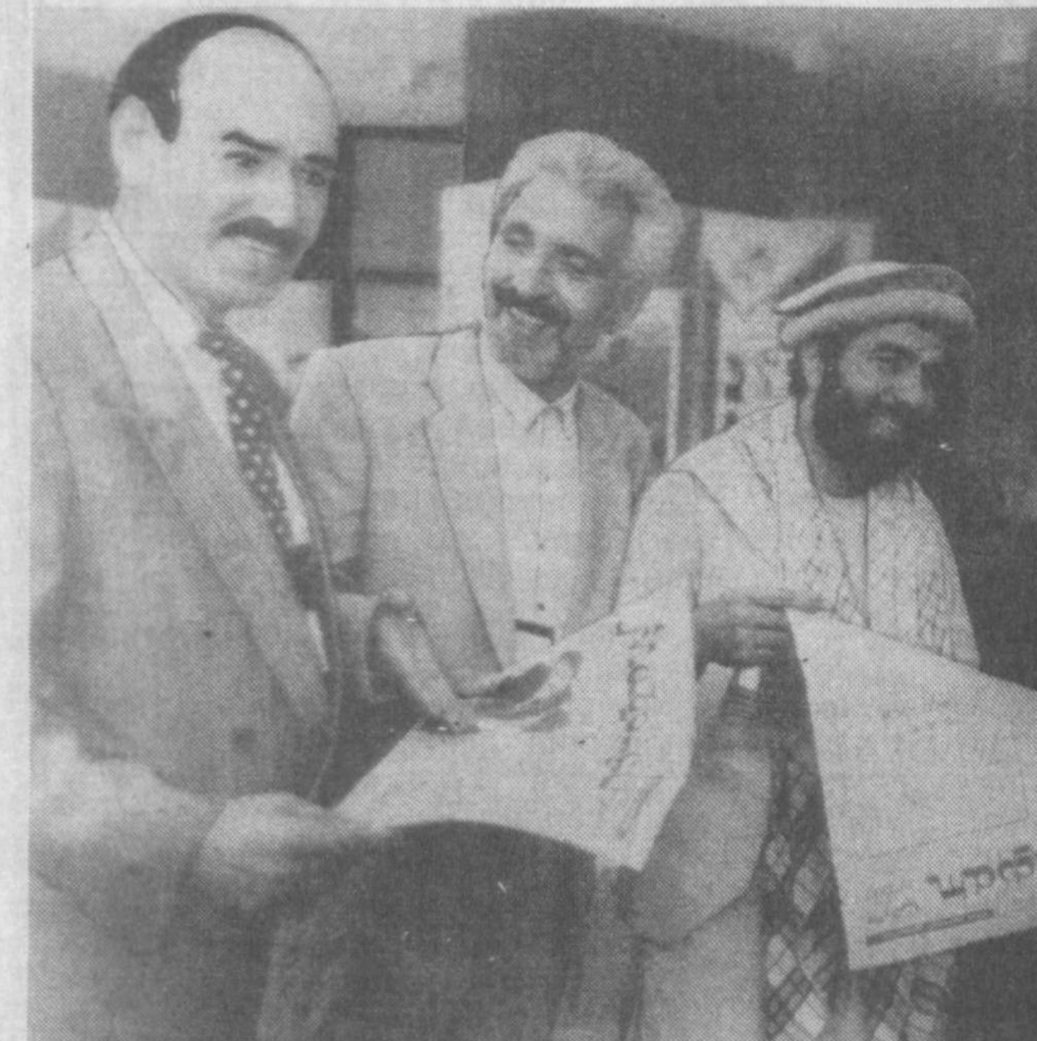
Яқинда бўлиб ўтган Оснё, Африка ва Латин Америка мамлакатлари XI Тошкент кинофестивали қатнашчилари ҳам «Маърифат» рўномасига қизиқиш билан қарашди. Фестиваль кунларида олинган ушбу суратда анжуман меҳмонларининг газета билан танишайтган пайти акс этган.