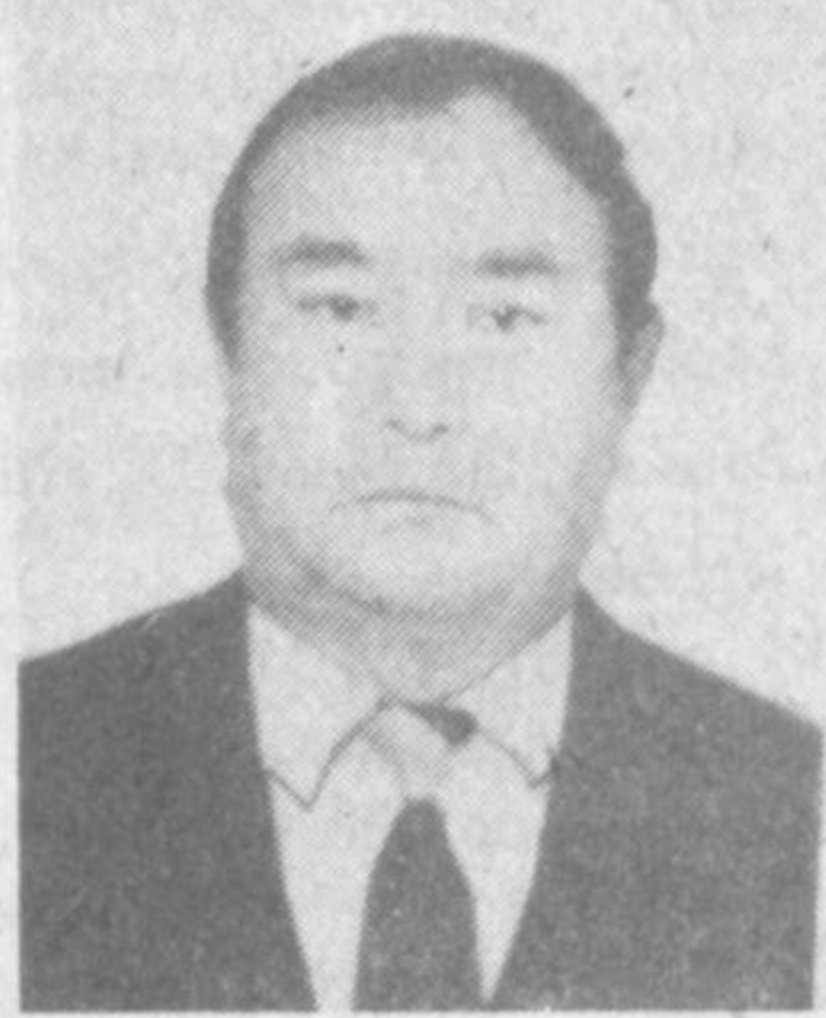
Хурматли Сайдирасул ПАРПИХҲАЕВИ!

Тошкент шаҳар Миробод туманидаги Н. Сафаров номидаги 147-мактаб жамоаси ва бир гуруҳ шогирдларингиз.