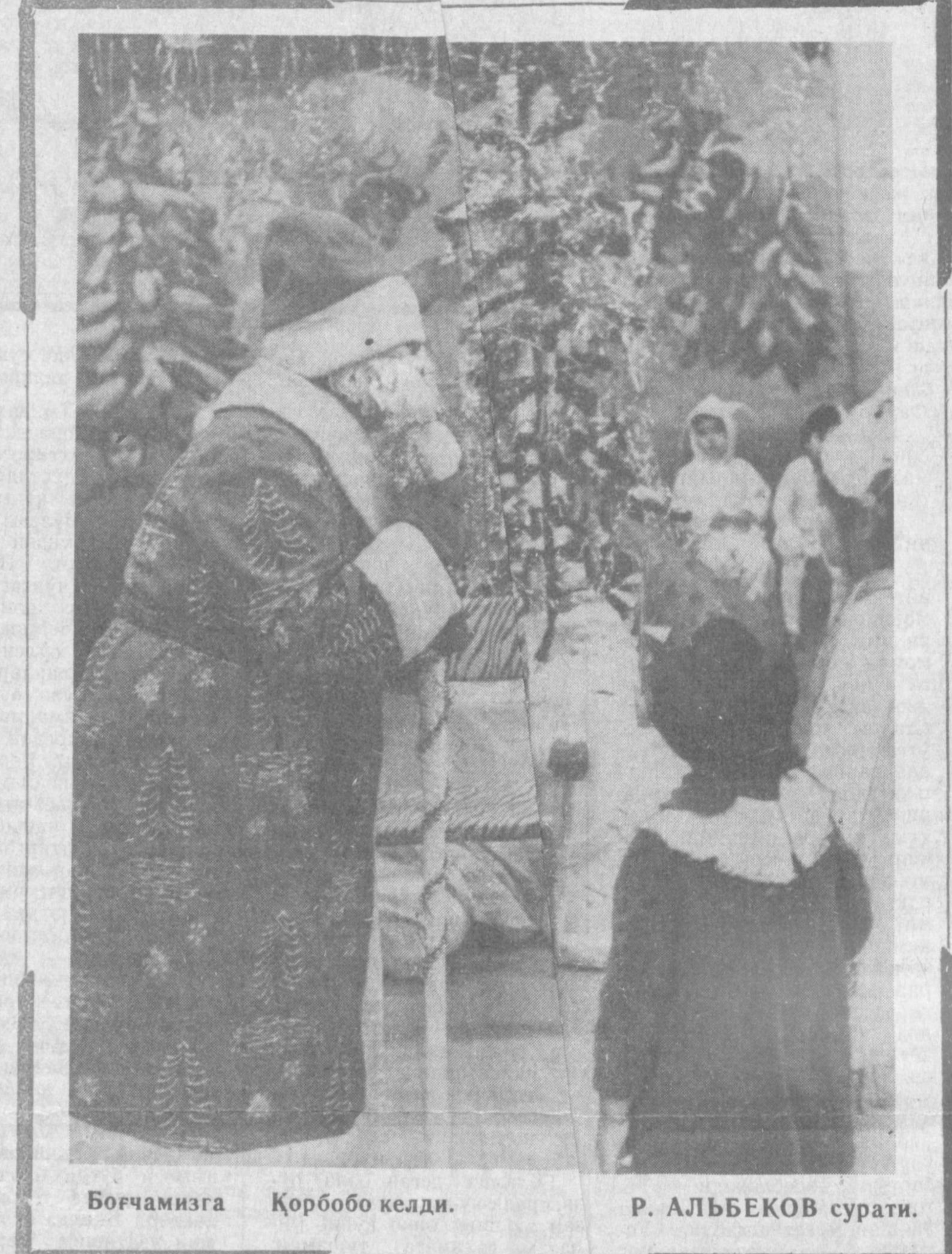
Боғчамизга Қорбобо келди.

Хусан КҲЖАЕВ вафот этганлиги муносабати билан марҳумнинг оила аъзолари ва қариндошларига чуқур таъзия билдиради.