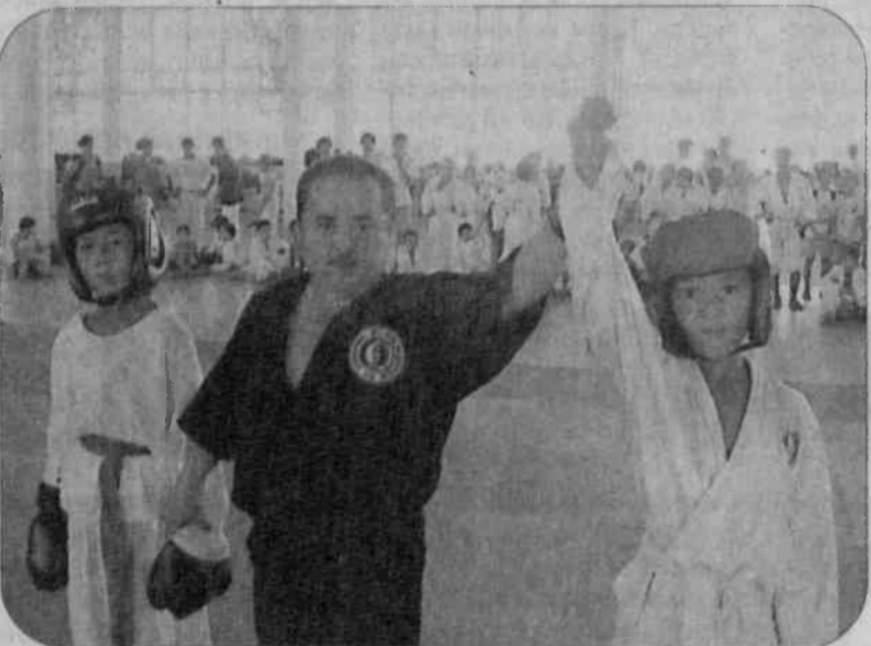
Суратда: мусобақадан лавҳа.