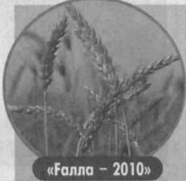
«Галла - 2010»

Бирлашган Миллатлар Ташкилоти, деди жаноб Пан Ги Мун, Қирғизистон жануби ва бутун мамлакатдаги вазиятни бевосита назоратга олган ва вазиятни барқарорлаштириш бўйича тезкор чоралар кўради.