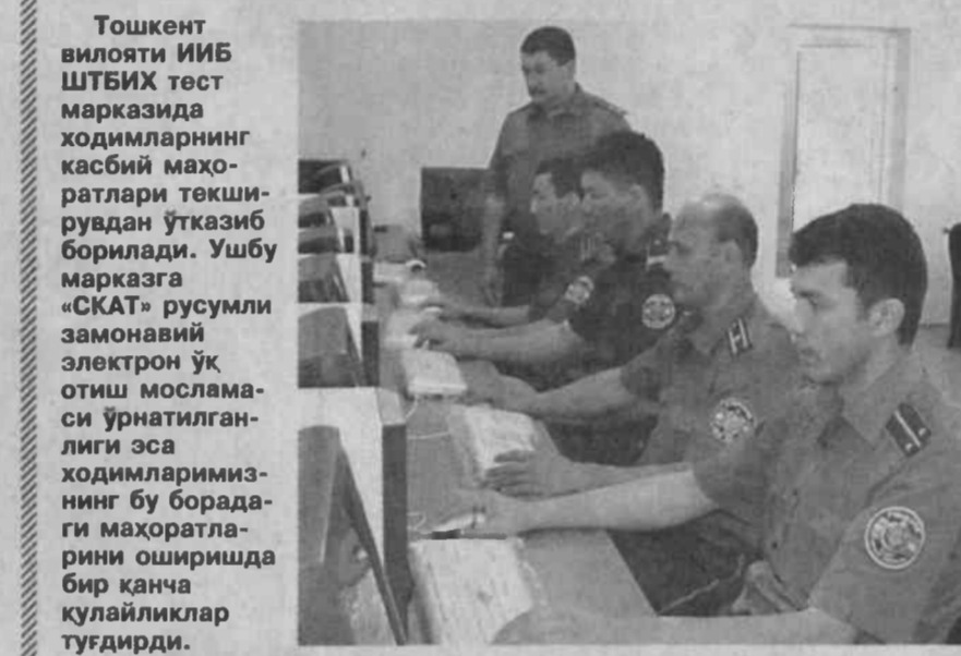
Тошкент вилояти ИИБ ШТБИХ тест марказида ходимларнинг касбий маҳоратлари текширувдан ўтказиб борилади. Ушбу марказга «СКАТ» русумли замонавий электрон ўқ отиш мосламаси ўрнатилганлиги эса ходимларимизнинг бу борадаги маҳоратларини оширишда бир қанча қулайликлар туғдирди.