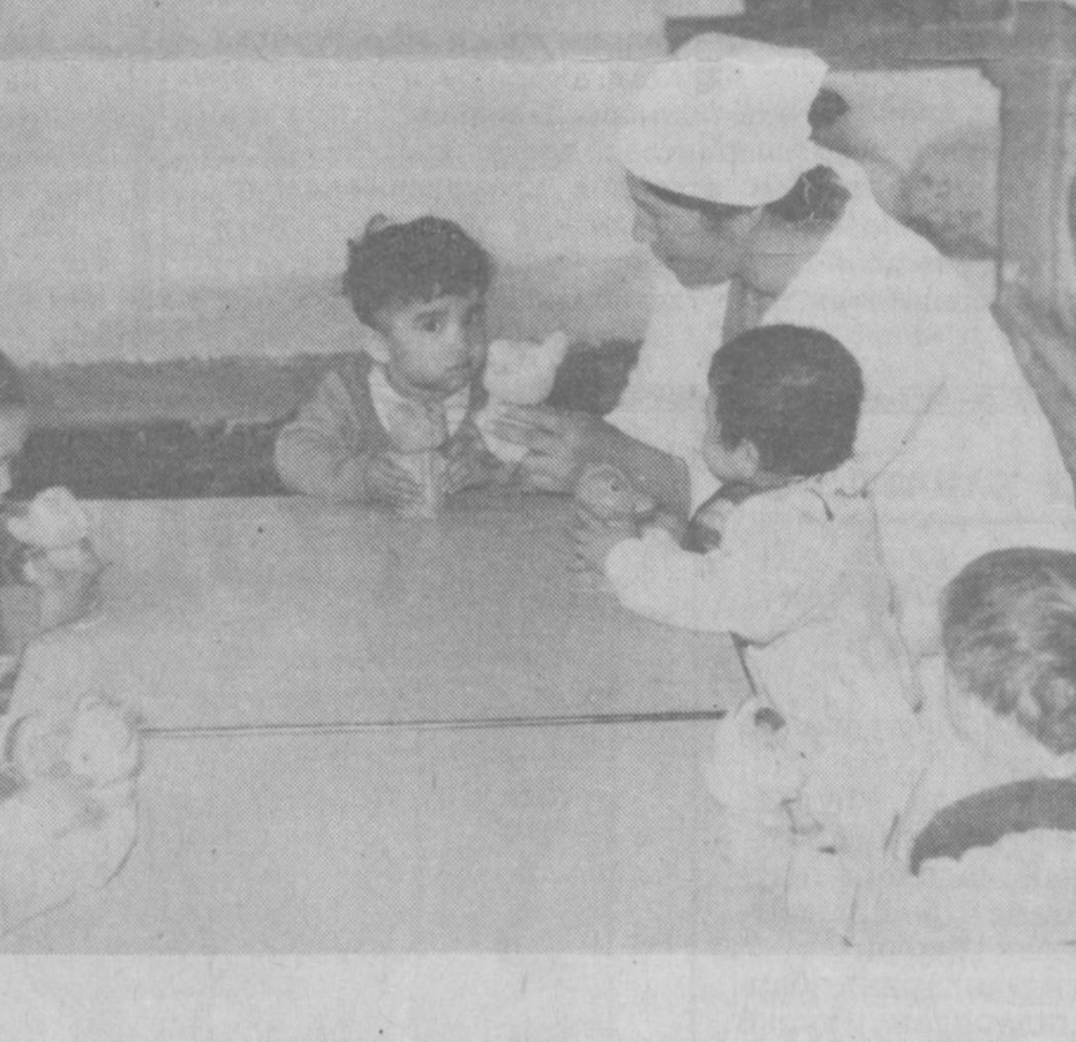
Мактаб ва экология