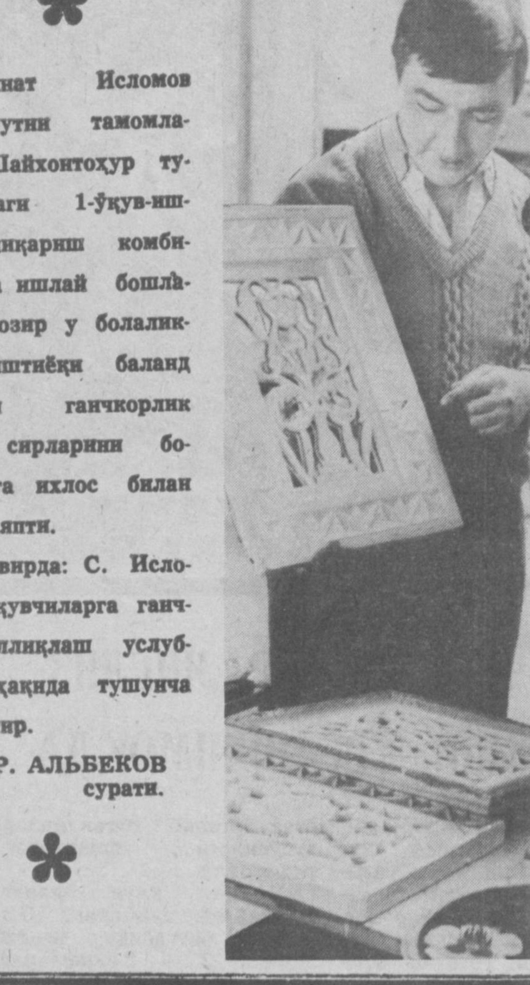
Суннат Исмолов институтини тамомлагани, Шайхонтоҳур туманидаги 1-ўқув-ишлаб чиқариш комбинатига ишлаб бошладди. Ҳозир у болалиқдан иштиёқ билан бўлган ганжкорлик касби сирларини болаларга яқнос билан ўргатапти.

О. ФАЙЗУЛЛАЕВА, Самарқанд шахридаги 49-ўрта мактабининг тил ва адабиёт ўқитувчиси.