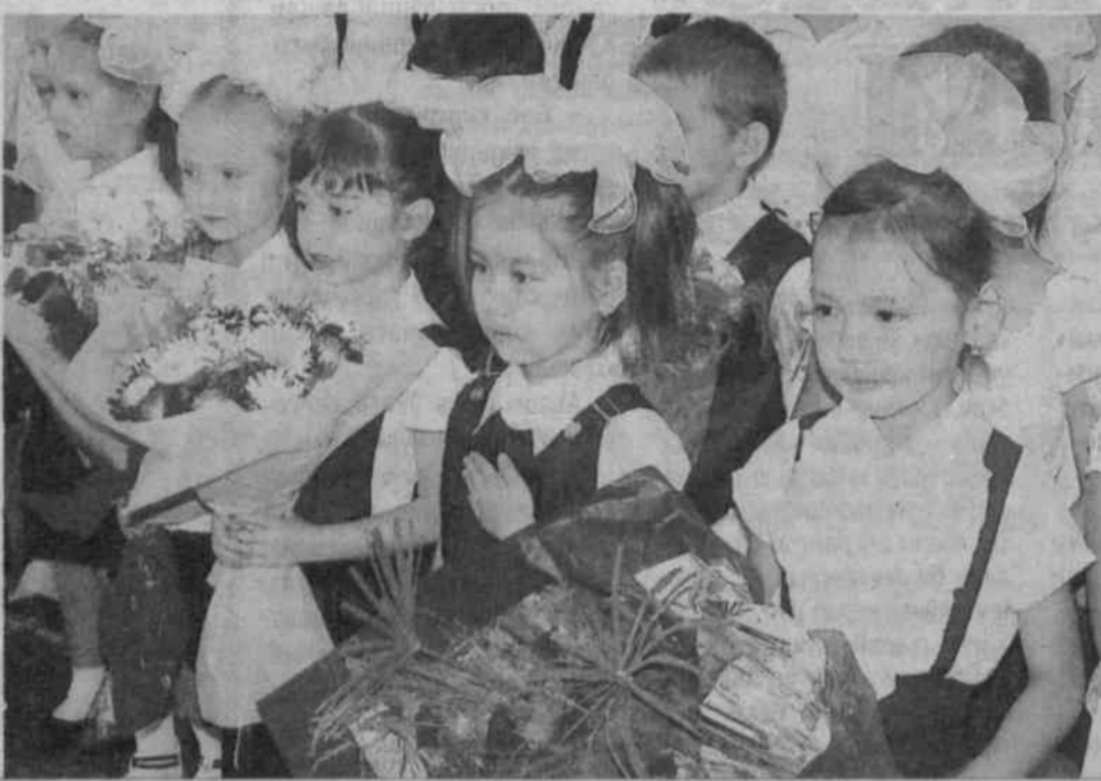
Суратларди: янги ўқув йили ўғил-қизларга янада қувонч олиб келди.