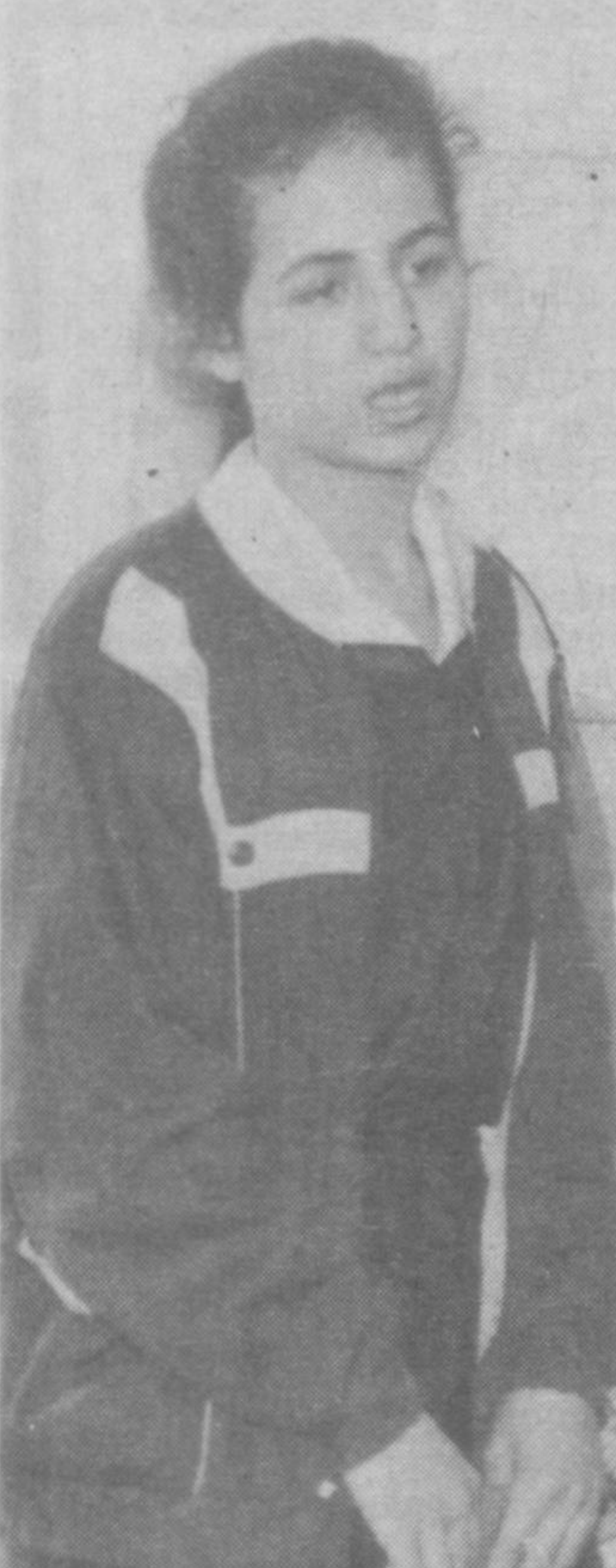
Сурхондарё вилояти Сарвасе туманидаги 86-мактаб интернатда умумтаълим мактабларининг она тили ва адабиёт фанидан республика олимпиадаси бўлиб ўтди. Унда барча вилоятлардан ва Қозғистон Республикасидан истеъдодли ўқувчиларнинг вакиллари қатнашдилар.

ридик. Муаллимлик гоёт олижаноб ва жуда қийин касб бўлиб, у кишидан ўз умрини шу касбга бағишлашни, доимий ижодкорликни, тинимсиз изланишни, зўр қалб саховатини болаларга бера олишни, меҳр-муҳаббатни, ўз ишга астойдил садоқатни талаб қилади. Шундай ўқитувчигина болаларнинг ҳам, халқнинг ҳам чуқур миннатдорчилигини ва ҳурматини қозонади. Ўзбекистон ўқитувчиларининг кўп миқтатли отряди мамлакатимизнинг ифтихори — ёшларни тарбиялашда мустақил республиканинг ишончли таянчидир. Бироқ гуруҳ ичидидаги кўрмак каби айрим мактабларда мураббий билан шогирд ўртасида йўл қўйиб бўлмайдиган, беъмани муносабатлар ҳам учраб туради. Бунинг асосий сабаби, ўқувчи билан ўқитувчининг бир-бирдан гумонсиратишидир. Гоҳо ўқитувчи бола қалбини эзгу характерини сезмайди, боланинг дарду қувончларига шерик бўла олмайди, ҳаёлан ўзини бола ўрнига қўйиб кўришга ҳаракат қилмайди. Зотан, ўзи бола бўлганини ҳеч қачон унутмайдиган кишигина ҳақиқий ўқитувчи