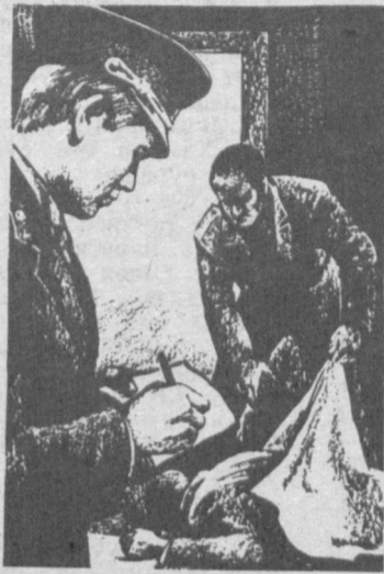
(Давоми. Боши аввалги сонларда)