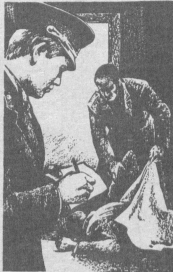
(Давоми. Боши аввалги сонларда)