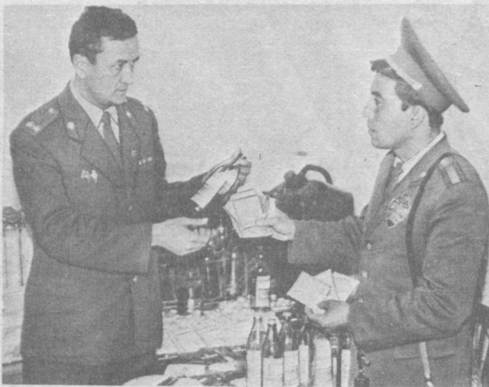
Ўғирлаб кетишга тайёр қилиб қўйган экан.

Шу кунийё Ҳаким Восиқовнинг заводдаги алоҳида хонаси тинтиб кўрилди. Буни қарангки, қаҳрамонимиз 10 шиша ароқ, 5 мингга яқин қопқоқ ва ёрлиқларни