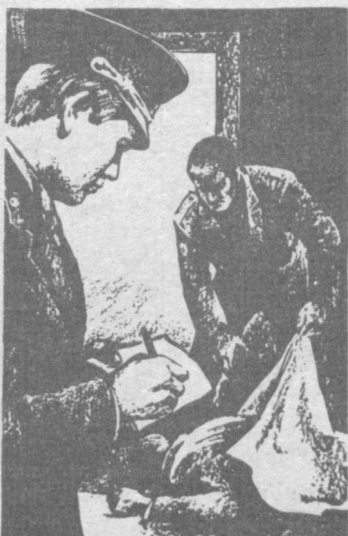
(Давоми. Боши аввалги сонларда)