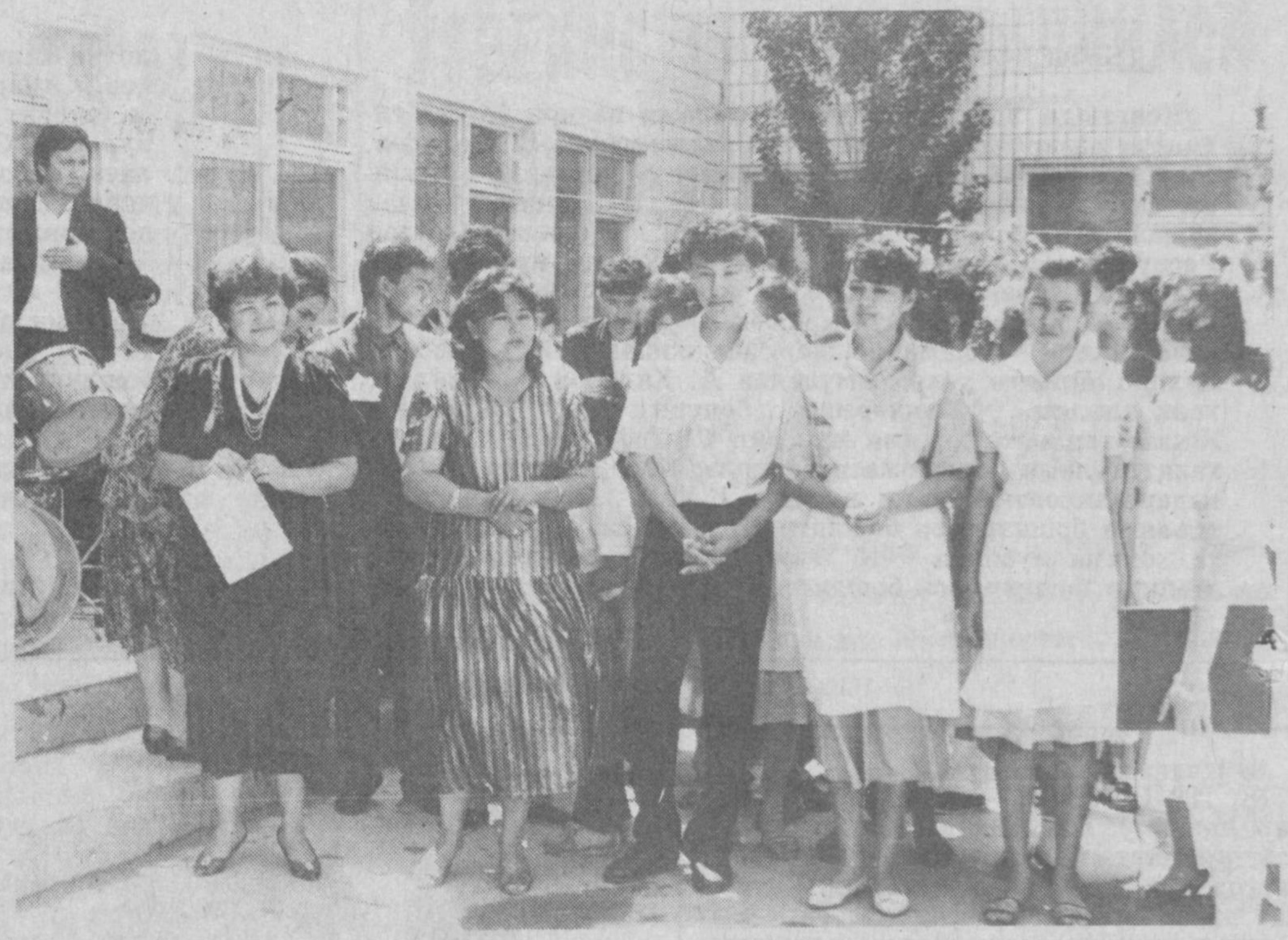
Ушбу ўйчан йиғит-қизларни кўриб хайрон бўлмаг. Ҳадемай, бу ёшлар, республикамиздаги миля-миляларча тенгдошлари қатори мустақил ҳаётга учирма бўлишди. Кимдир олий ўқув юртида ўқишини давом эттирса, яна кимдир завод-фабрикалар даргоҳига йўл олади. Лекин ўн бир йил ўқиб, қадрдон ва азиз маскан бўлиб қолган жонажон мактабларидан кетини осонмикан? Суратда: пойтахтимизнинг Акмал Икромов туманидаги 287-мактабининг битирувчи синф ўқувчиларини хайрлашув онларида кўриб турибсиз.

салам қилса утру эмин бўлди жам мазмун: салом бирла одам эминдир, омон салом қилса бўлғай эмин тан ва жон аман берди эрқа салам қилгучи, саламат булудни алайқ алгучи. мазмун: омонлик этар бахш салом қилгучи, саломатлик олғай алайқ олгучи. салам ул саламат киши шарринга, саламатлик алди януг қилгучи. мазмун: саломдир омонлик одам айбига, омонлик топади жавоб қилгучи, улуглар керакким кичикка салам, ашудурса утру бўлур иш тамам. мазмун: уруглар кичикларга аввал салом, берад эрсалар гар бўлар иш тамом. кичиг бўлса эмин улуг шарридин, саламат бўлурса умуб хайридин. мазмун: кички бўлса эмин улуг қаҳридан, хотиржам умидвор бўлиб хайридан. менингим элигга қачан тегга шарр, кичикким кичигдин негу яси бар. мазмун: нечук бекка мендан ёмонлик этар, кичикким, кичикдан хатар йўқ, зарар. элиг элиг барча бузувча эгуви, негу кулса қилғай тулгулса юзун, мазмун: ҳоқон қўли борлиқ эл узра этар, не истаса қилғай, газаб қилса гар, кўру бер қара бетга қилмас салам, бу маъин учун ул эй билли тамам. мазмун: назар сол, авом бекка қилмас салам, сабаб шу, эй нима мудом ногамом. бўлу бермадим ман сўзинг тутмадинг, бу аличн ажунқа узун бутмадинг. мазмун: бўйин бермадим ман сўзинг олмадинг, бу айёр жаҳонга назар солмадинг. таки йиғанур эрдим эжди сенга, саламин аман бердинг эжди менга. мазмун: ҳадик, таҳликада боқардинг сенга, салом бирла бердинг омонлик менга. Қ. КАРИМОВ.