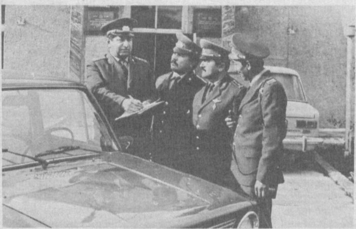
Калинин тумани ИИБ ҳузуридаги қўриқлаш бўлимига бир қанча муҳим аҳамиятга

Тезкор гуруҳнинг биринчи галдаги вазифаси мурданинг