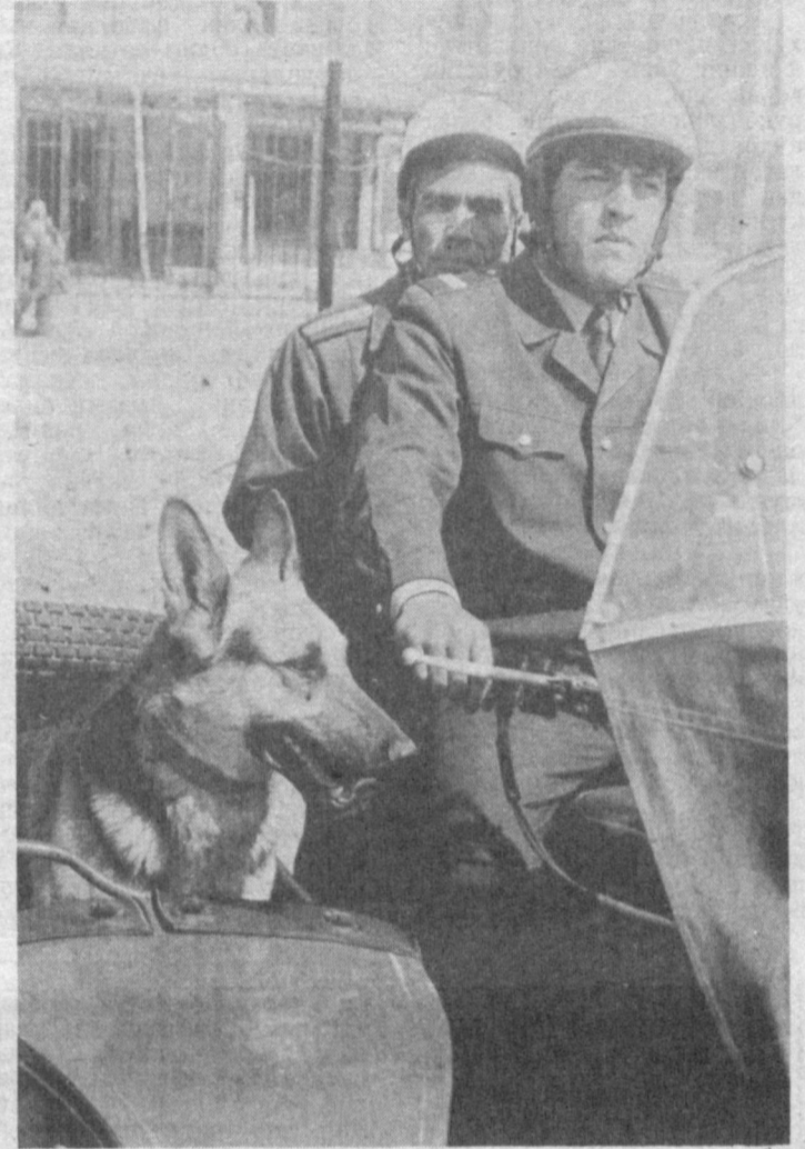
МУНОСИБ ҲИССА ҚЎШИШМОҚДА

Андижон шаҳар ИИБнинг милиция бўлаги ходимлари топшириқларни сидқидилдан бажаришиб, тартиббузарликлар ва жиноятларнинг олдини олиш ишига муносиб ҳисса қўшиб келишмоқда.