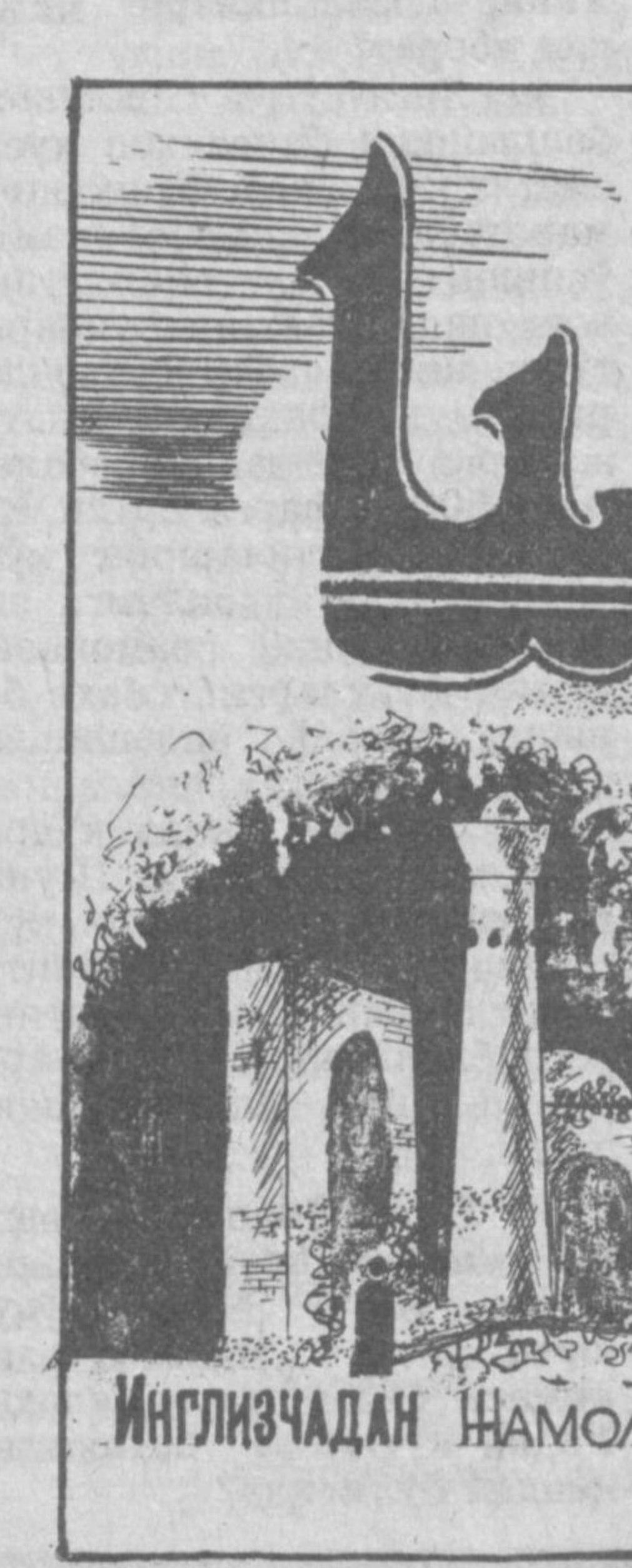
Инглизчадан ҲАМОЛИДДИН ҲАМДАМ ВА ШАРИФ ҲОЛМУРОД ТАРЖИМАСИ

кий ворислари назоратидаги мудоава туманига айлантирилган Кипрни эгаллаганилари уларнинг ютуқларидан бири бўлди. Зеро, собик салб юришчилар бу ердаги сув йўлларида қарқичили билан шуғулланиб, мусулмон кемаларига хавф солиб туришарди. Султон Барслей уларга қарши куч юбориб, оролини босиб олди. Кияларнинг мағлуб қиларкан, минг нафар киши буйинга занжир солиб у ердан ҳайдаб чиқарди. Шундан кейин Родосни эгаллаб турган авлиё Жон князлари султон Барслей билан сулх тузишга мажбур бўлдилар.