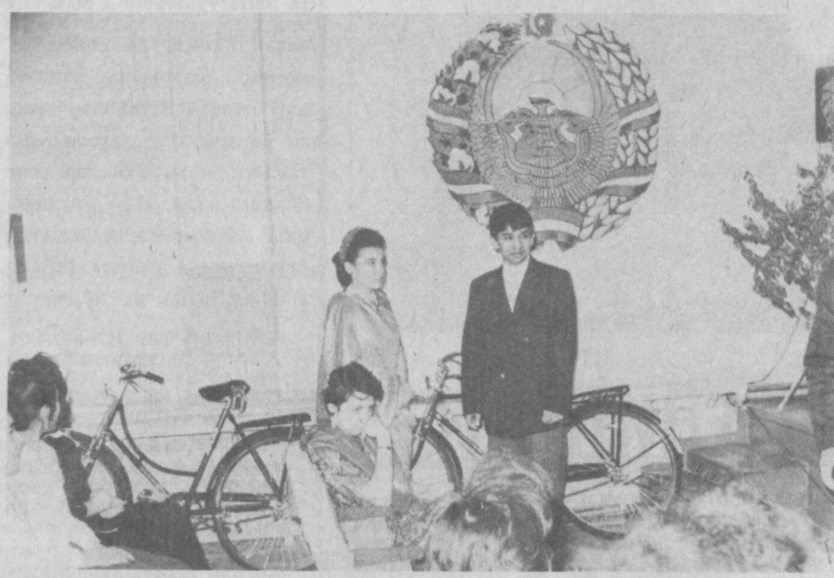
Аввал хабар берганимиздек, Ҳиндистон Республикасининг Ўзбекистондаги элчиси жаноб Далил Мехта рафиқаси билан Тошкент шаҳридаги 24-ўрта мактаб жамоаси ҳузурда меҳмон бўлди. Элчи жанобларнинг айнан шу мактабга ташриф бекис эмасди. Халқнинг тилини билиш, унинг дилига кўриб бориш билан берабар, деган ибратли ҳикматта амал қилаётган ушбу мактаб жамоаси ўғил-қизларга шарқ тиллари, хусусан, ҳинд тилини чуқур ўргатишгаги. Шу қаторда ўқувчилар ҳинд халқининг урф-одатларини, анъаналарини, маданиятини, тарихини ҳам атрофлича ўрганишмоқдалар. Ҳиндистон мамлакатини тарихда буюк бобоқалонимиз Ҳазрати Бобурнинг нафаслари сезилиб туради. Бобур у ерда марказлашган давлат тузиб, Ҳиндистон мамлакатини келажакга асос солиди. У ўз атрофига меймор, ҳунарманд, расом, шоир ва мушаррафларни тўлади. Улар ёрдамида ажойиб ишоот ва кўприкларни бунёд этди, бир гуруҳ шоир ва шуаролардан иборат адабиёт бўстонини яратди. Сулоалари аса буюк шоир ва саркарданнинг ишларини давом эттиришди.

Лишда ўртага ташланган тадбирларни иноватга олган ҳолда қабул қилинди. Кун тартибдаги иккинчи масала — «1993 йил капитал қурилиш режасини бажариш ақунлари ва вазирликнинг 1994 йилги капитал қурилиш ҳамда иктимой-иқтисодий ривожланиш режалари тўғрисида» вазир ўринбосари Муртазо Султонов маъруза қилди. Бозор иқтисодиётига ўтиш шароити қийинчиликларига қарамай, ўтган йилда ҳам умумтаълим мактаблари, мактабгача тарбия ва мактабдан ташқари муассасалар, ҳунар-техника билим юрлари қуриш ишлари режалаштирилганига нисбатан бажарилиди. Чунончи, 99 миң 577 ўқувчи ўрнига мўлжалланган мактаб қурилиши 121 миң 546 ўқувчи ўрнига етказилди. Янги бинолар қурилиши ва таъмирлаш ишлари учун давлат хазинасидан 404 миллиард сўмдан зиёд маблағ асосан ўзлаштирилди.