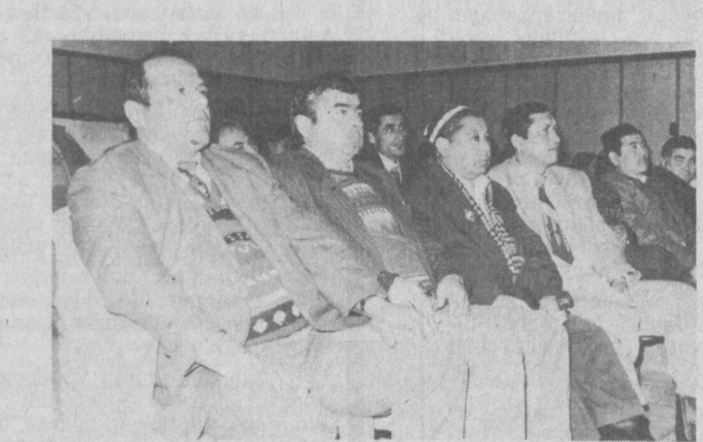
Андижон шаҳридаги собиқ 46-мактабда (ҳозир у 2-гимназияга айланган) кўп йиллардан бун халқ университети фаолият кўрсатиб келади. Ота-оналар болалари мактабин битириб кетган бўлса-да, фарзандларининг

мактаб бинолари қуриш бўйича Самарқанд, Сурхондарё вилоятлари йиллик режаларини ошириб удалайдилар. Бирок Навоий, Жиззах вилоятлари бу масъул ишда сустхаликка йўл қўйишди. Шунингдек, бир қанча вилоятлар халқ таълими муассасалари маҳаллий мольна таъкилотлар билан мустақиллик алоқа ўрната олмангандликлари бонс ажратилган маблағларни тўлиқ ўлашти. ра олмайлар Маблағ етиш. маслиги оқибатида қурилиш ишлари поёнига етай деб қолган баъзи бинолар фойдаланишга топширилмай қолди. Ҳайъат йиғилишида таълим муассасалари қурилишида йиллик режа бажарилишини таъминламаган ХТБ вакилларига жиддий танбех берилди. Йиғилиш муҳокама этилган масала юзасидан тегишли қарор қабул қилди. Ҳайъат йиғилишида кадрлар масаласи ҳам кўриб чиқилди. Шунингдек, Ўзбекистон Радио ва телевидение Давлат қўмитасининг таълим ислохотини тарғибот этишига фаолиқ кўрсатиб келаятган бир гуруҳ ходимлари «Халқ маорифи алоқиси» нишонини билан тақдирландилар.