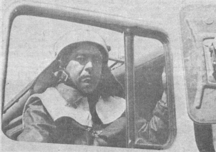
Қорақалпоғистон шўро жумҳуриясининг Манғит шаҳридаги профессионал ёнгиндан сақлаш отряди жамоасида ўз касбига садоқатли ходимлар оз эмас.