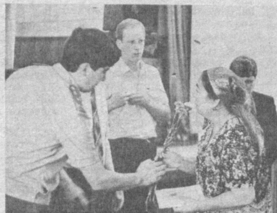
СУРАТЛАРДА: учрашув лаҳзалари.