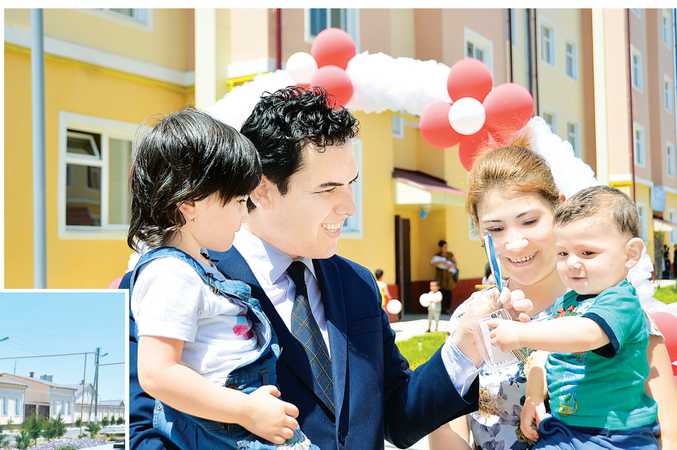
Уникальный механизм финансирования строительства жилья позволяет молодым семьям стать владельцами современных квартир и домов.

комфортные дома, разработаны, по сути, уникальный механизм финансирования строительства жилья, выгодный и удобный для населения, в особенности для молодых семей.