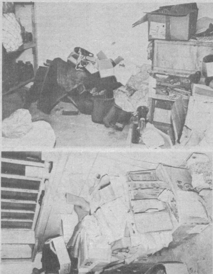
СУРАТЛАРДА: дўкон мудирининг уйига яширилган пойафзаллар.