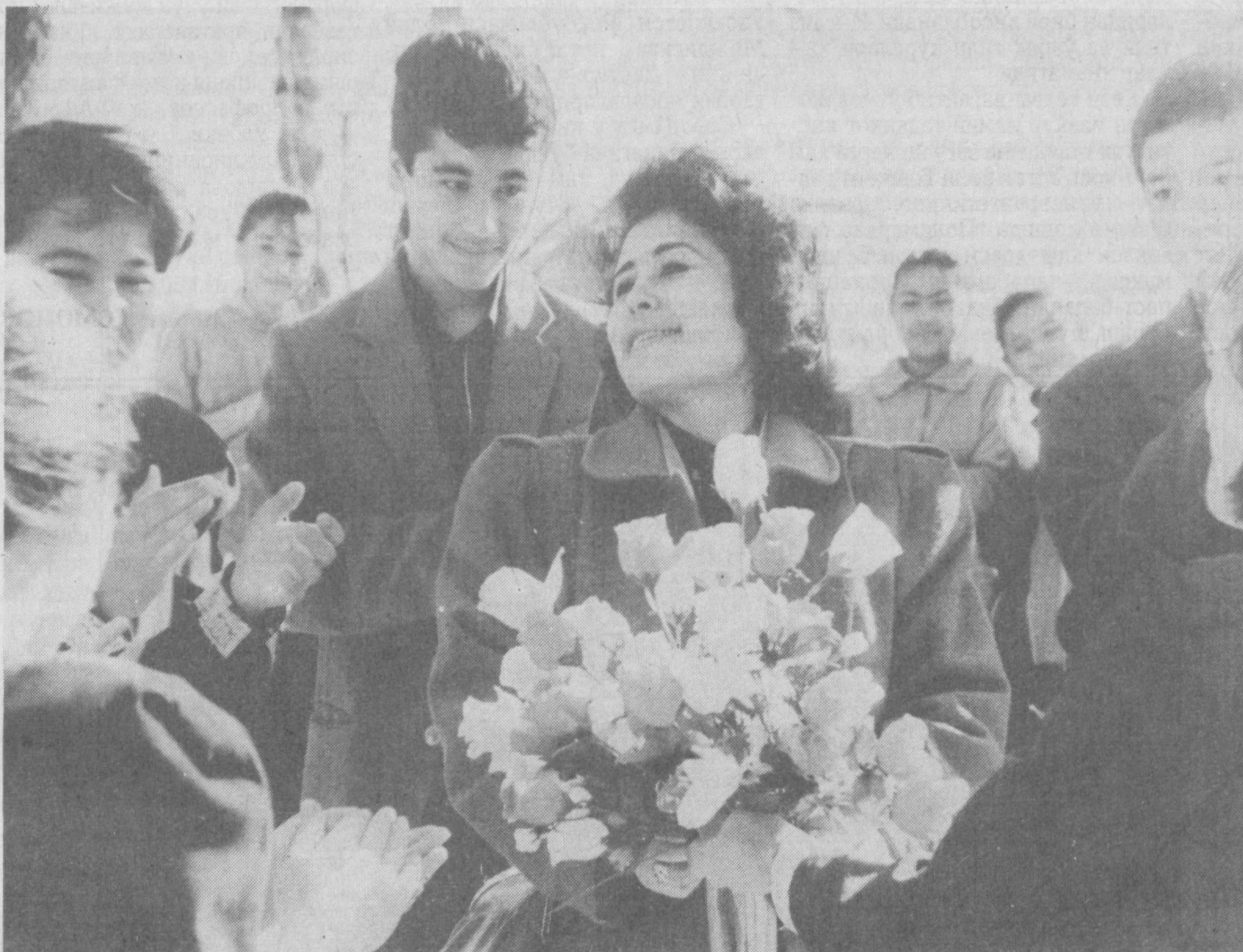
ГУЛГА ЭВРИЛГАН МЕҲР

Аёл ва гул... Иккинчи дам ҳаёт меҳвари. Бирини гул-гул яшаб, муаттар бўй таратиб, кўзларни қувонтира, иккинчиси башариат наслининг давом эттирувчиси, меҳр-мурувати ила умр шамчирғини ёлқинлантирувчи олий зотдир.