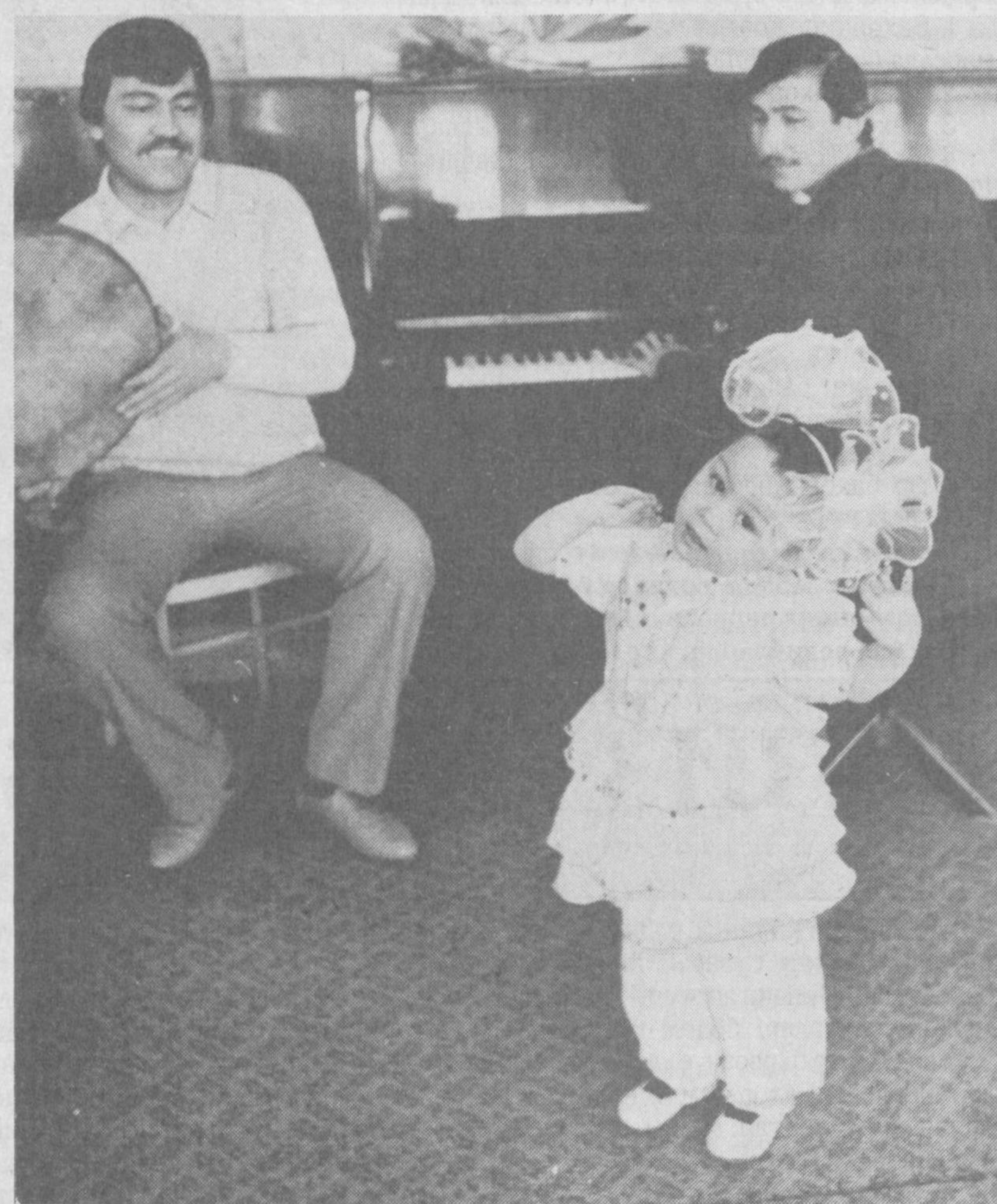
"Онажоним омон бўлсин бошингиз"