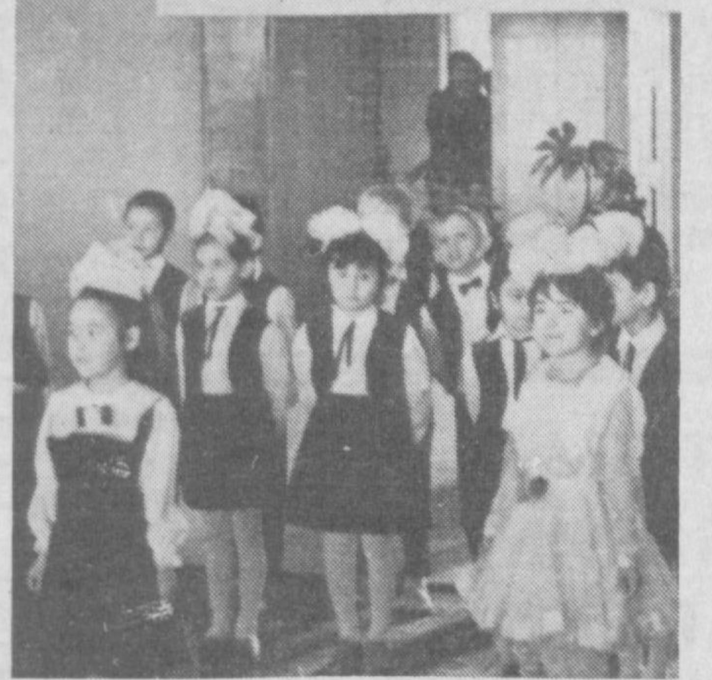
Шу азиз Ватан бағчалариники